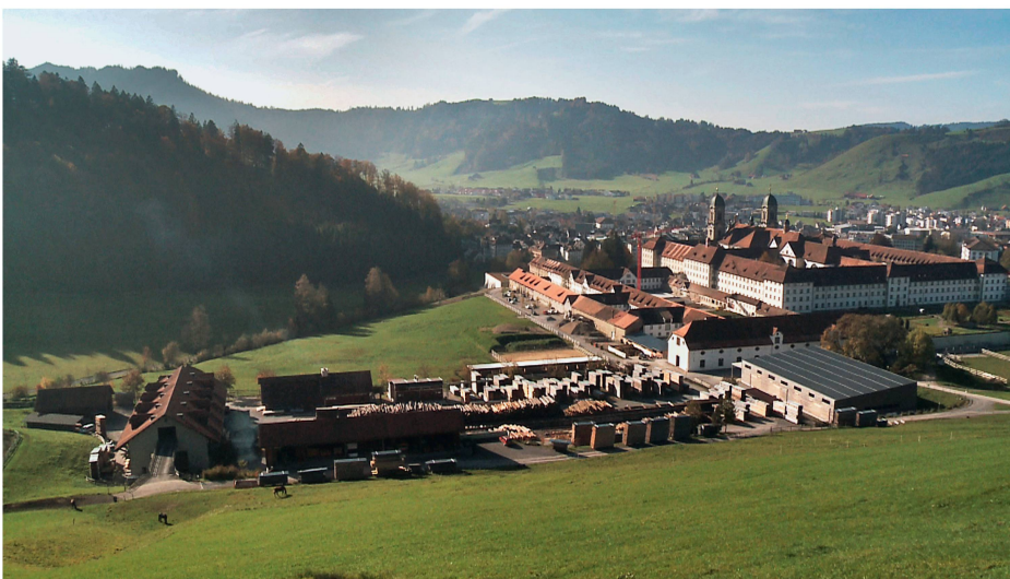
Holzhof und Kloster der Stiftsstatthalterei Einsiedeln.