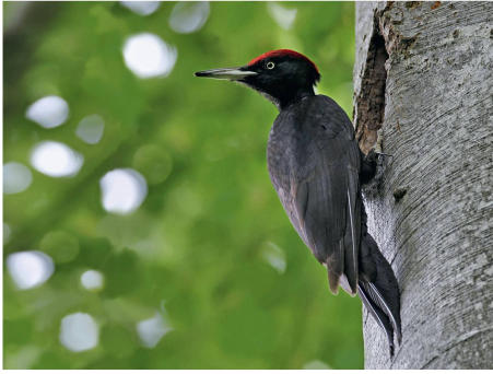
Le pic noir.

L'Association Suisse pour la Protection des Oiseaux (ASPO) a élu le pic noir oiseau de l'année 2011. Le plus grand pic de Suisse a besoin de vieux hêtres et sapins. Au moins 60 autres espèces animales profitent des cavités qu'il creuse en forêt. Il détient ainsi une fonction-clé dans cet écosystème. Avec l'oiseau de l'année 2011, l'ASPO lance sa nouvelle campagne de cinq ans «La biodiversité en forêt». ■