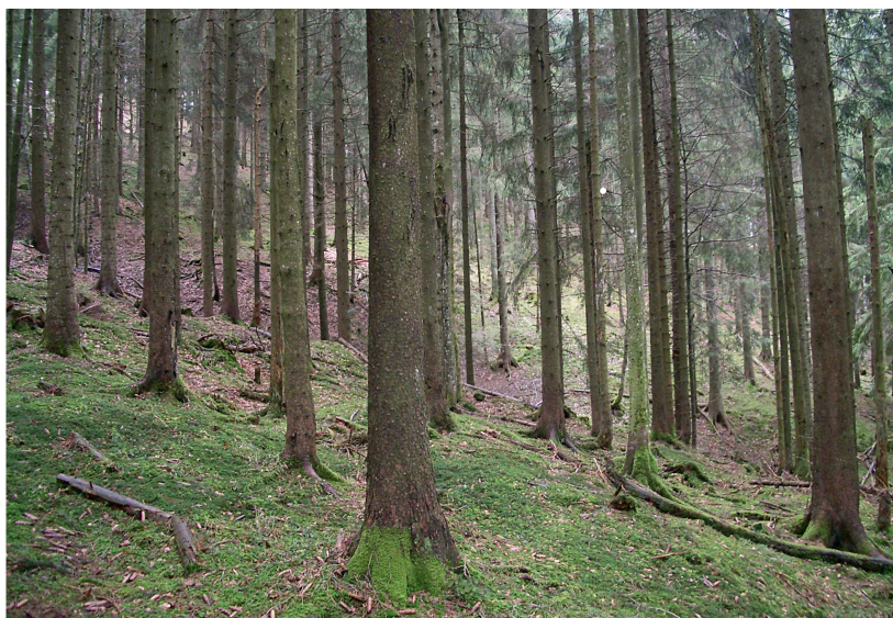
Abb 5 Beispiel eines Bestandes mit Lebensraumeignung 5 (ungeeignet) nach Schroth (1994).