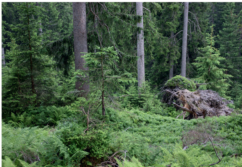
Abb 4 Beispiel eines Bestandes mit Lebensraumeignung 1 (optimal geeignet) nach Schroth (1994).

Das Anforderungsprofil beschreibt den Sollzustand für die Waldbestände gemäss den Kriterien der wissenschaftlichen Literatur (Bollmann et al 2008a, Imhof 2007, Lanz & Bollmann 2008). Bei der Beurteilung eines Bestandes werden der Istzustand des Waldes und die voraussichtliche Entwicklung ohne forstliche Eingriffe in den nächsten zehn beziehungsweise fünfzig Jahren mit dem Sollzustand gemäss Anforderungsprofil verglichen. Dieser Vergleich zeigt das allenfalls bereits bestehende und das in Zukunft zu erwartende Defizit in der Lebensraumqualität und damit den Handlungsbedarf. Darauf aufbauend werden die nötigen waldbaulichen Massnahmen herge-