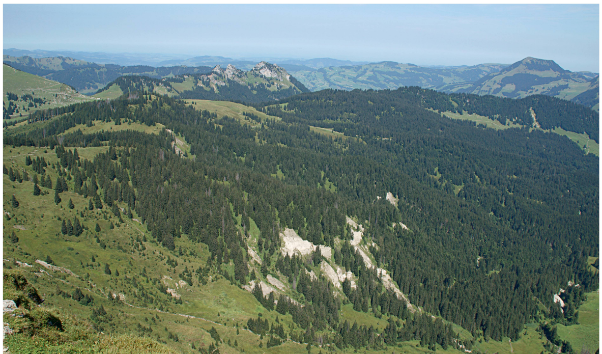
Abb 3 Übersicht über den östlichen Teil des Reservats.

Für die Herleitung des Handlungsbedarfs und die Planung der Eingriffe ist eine detaillierte Über-