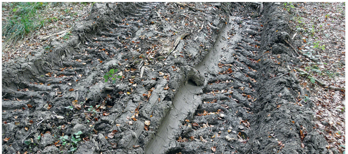
Abb 1 Eine Befahrung von Waldböden mit Forstmaschinen kann im Bereich der Fahrspuren zu tief greifenden und lang anhaltenden Veränderungen im Boden führen, die von aussen nicht sichtbar sind.

Mit Befahrungsexperimenten im Forst (Heiteren) bei Bern im schweizerischen Mittelland – der Standort gehört zum Waldmeister-Buchenwald (Ellenberg & Klötzli 1972) – wurde versucht, die auf-