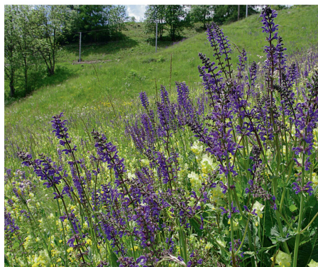
Trockenwiesen und -weiden gehören zu den stark bedrohten Lebensräumen.

In der Verordnung über den Schutz der Trockenwiesen und -weiden von nationaler Bedeutung werden Umsetzung und Vollzug des neuen Inventars der Trockenwiesen und -weiden von nationaler Bedeutung festgelegt. Die Vollzugshilfe präzisiert die Verordnung vor allem im Bereich der angepassten Bewirtschaftung und Nutzung der Lebensräume. ■