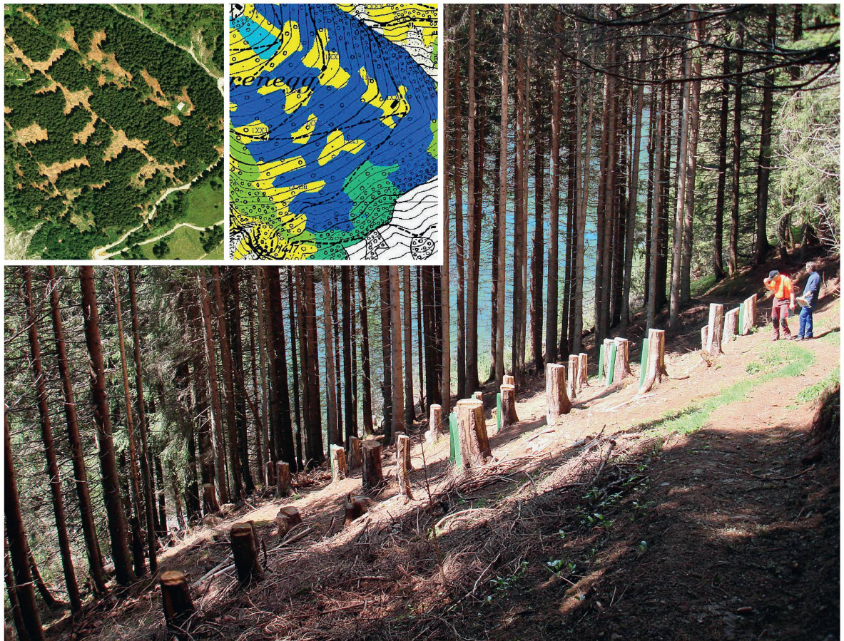
Abb 2 In einer Aufforstung oberhalb von Frutigen wurden 2006 fischgrätartig Schlitzte zur Verjüngung und Schaffung stabiler Strukturen angelegt, wie sie in Luftbild und Bestandeskarte (2007; kleine Bilder) gut erkennbar sind.

Fotos und Bestandeskarte © SFB/KAWA, Karte © Amt für Geoinformation des Kantons Bern