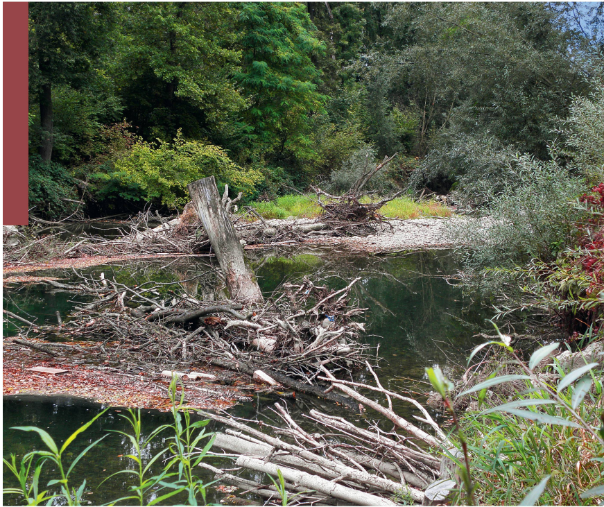
Abb 4 Grundwasserschutz ist ein öffentliches Gut, das unter bestimmten Voraussetzungen auch vermarktet werden kann.

Zielfunktion dieser jedoch zu berücksichtigen hat, ist eine weitere Frage, die auf der operationalen Ebene zu beantworten ist. Allein die Zuteilung des Rechts am Kohlenstoffspeicher Wald beantwortet noch nicht die Frage, welche Regularien für die Messung des Kohlenstoffgehaltes anzuwenden sind oder welche Risikoaufschläge für den Fall eines Brandes oder Windwurfes vorzunehmen sind. Ähnlich könnte bezüglich der Regularien von Hochseilgärten argumentiert werden.