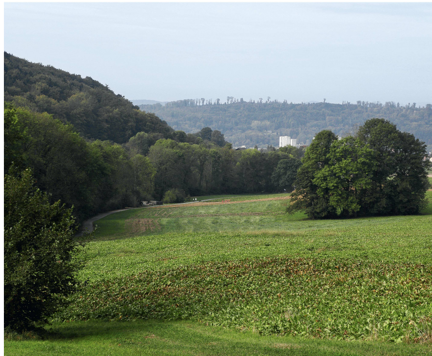
Abb 3 In der Schweiz unmöglich, in den USA ein marktfähiges Produkt: das Waldumwandlungsrecht.

Schmidtke 2010, dieses Heft), weitere Einkommensmöglichkeiten schaffen, die Ergebnis einer Neukombination von Verfügungsrechten sind.