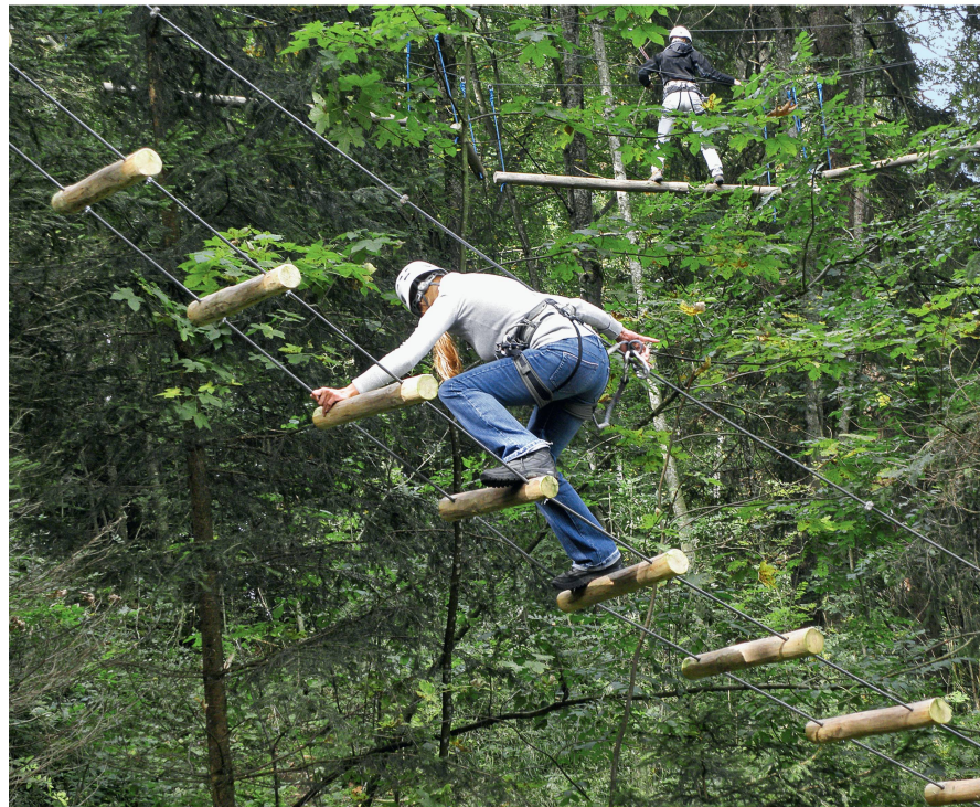
Abb 2 Hochseilgärten gehören zu den erst in jüngster Zeit entwickelten Gütern.

im Rahmen der Umsetzung der Gesetze durch die Verwaltung ergeben. So können neue Waldpachtverträge ohne Zweifel die Verfügungsrechte verändern, ohne jedoch zwangsläufig auch eine Veränderung auf der politischen Ebene zu benötigen.