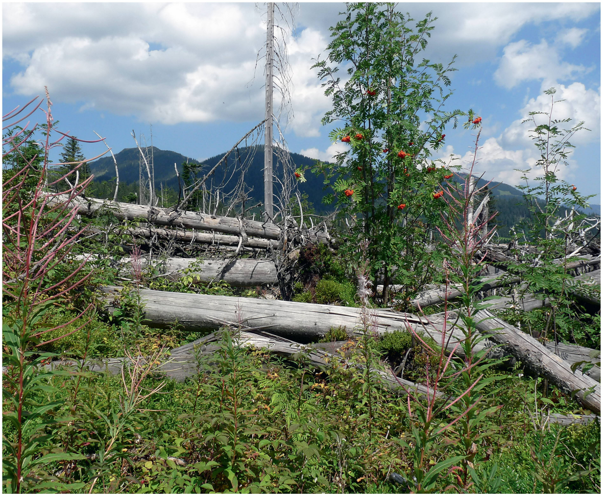
Abb 3 Neue Habitate entstehen durch extreme Naturereignisse. Im Bild ein Lothar-Windwurf im Rorwald, Kanton Obwalden.

nahme hat sich der Hohltaubenbestand von drei auf sieben Brutpaare erhöht. 1 Das Einzigartige an einem natürlichen Ökosystem oder konkret an einem Waldreservat ist die Selbstorganisation und -regulation. Die Arten variieren authentisch und nicht als Folge einer wohlpräparierten Waldarchitektur.