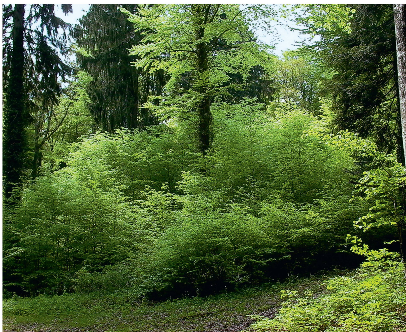
Fig. 2 Irrégularisation de la hêtraie par la coupe en mosaïque. Ici, les forêts communales de Gorgier (NE), division 12.