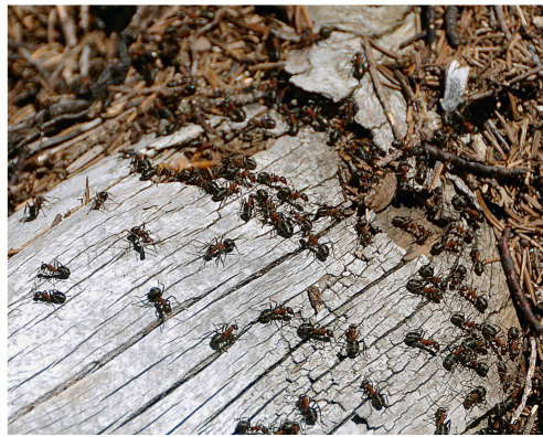
Abb 3 Alle Organismen tragen dazu bei, dass das Ökosystem Wald als Ganzes funktioniert.

zen, damit er seine Funktionen – in der heutigen, vom Millennium Ecosystem Assessment (2005) geprägten Sprachregelung würde es Ökosystemleistungen heissen – wahrnehmen kann (Art. 1 Abs. 1 lit. b). Der gesetzlich verankerte naturnahe Waldbau soll unter anderem dazu beitragen, dass der Wald in der Schweiz diese Funktionen dauernd und uneingeschränkt erfüllen kann (WaG Art. 20 Abs. 1). Das Bundesgesetz über den Natur- und Heimatschutz (NHG, SR 451) bezweckt zudem die Erhaltung der Vielfalt von einheimischen Arten und ihren natürlichen Lebensräumen (Art. 1 lit. d).