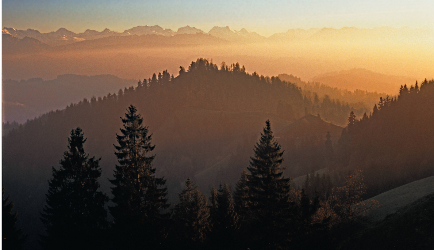
Abb 4 Die langfristige Erhaltung der Resilienz der Ökosysteme ist von grosser Bedeutung.