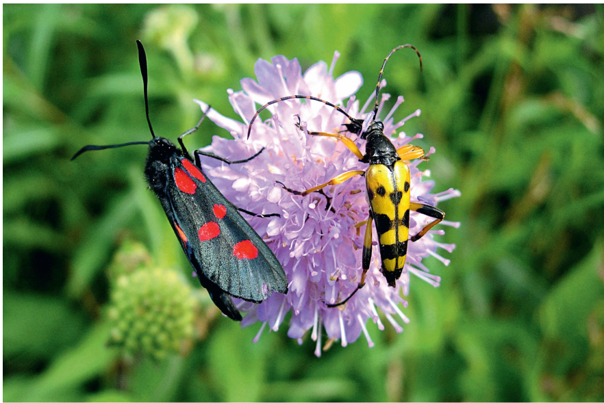
Fig. 1 Lepture tacheté en compagnie d'une zygène du chèvrefeuille.