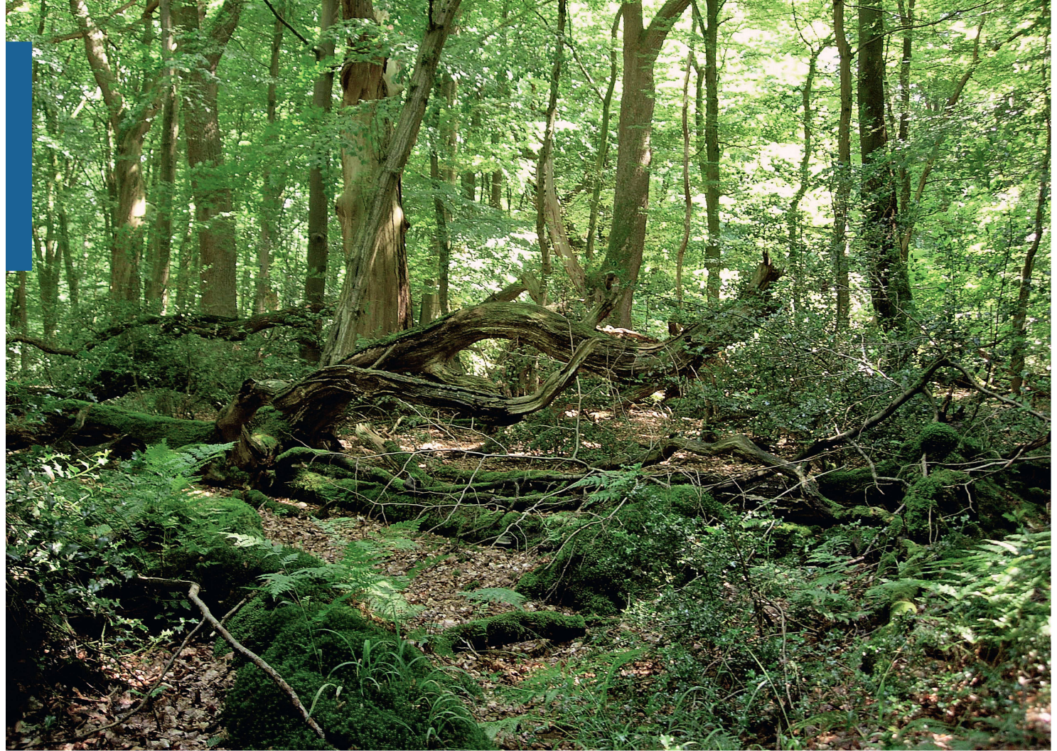
Fig. 3 Forêt de Hasbruch (Basse-Saxe, Allemagne): une forêt ancienne abritant des insectes rares et très spécialisés.

vail qu'ils effectuent coûterait des sommes faraimeuses et engloutirait une énergie colossale s'il devait être fourni par l'homme. Arrêtons-nous un instant sur les abeilles, insectes éminemment utiles en agriculture, afin d'en tirer un enseignement pour la forêt. Les abeilles se raréfient à une vitesse inquiétante. Les causes de leur déclin sont certes encore insuffisamment connues. Cependant, une grande partie des scientifiques s'accordent sur le fait que l'agriculture intensive et la diminution drastique des milieux riches en fleurs contribuent largement à leur raréfaction. La valeur économique des cultures liées à la pollinisation est estimée à 153 milliards d'euros au niveau mondial (Gallai et al 2009). L'enseignement à tirer? La production de biens utiles à l'être humain doit se faire avec et non contre la nature, en agriculture comme en sylviculture. Conserver la biodiversité forestière est une nécessité. Il faut donc doser l'influence humaine pour ne pas mettre en péril la pérennité de la forêt semi-naturelle et les services qu'elle nous rend.