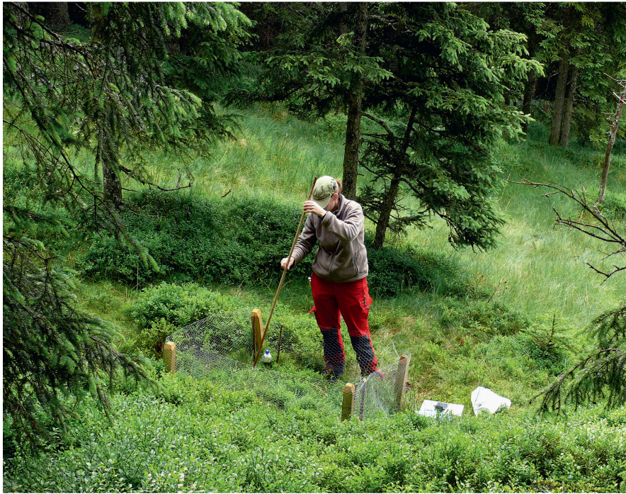
Abb 2 Messung der an der Vegetation haftenden Wassermenge mit saugfähigem Papier, das an einem Holzstab befestigt war.

Die Reihenfolge der Vegetationstypen variierten wir von Tag zu Tag. Wir führten die Versuche mit den Küken nur durch, wenn es nicht regnete. Insgesamt resultierte eine Stichprobe von 91 Beobachtungssequenzen und Wassermengennmessungen. Jede Beobachtungssequenz und jede Wassermengennmessung betrachteten wir in der Auswertung als unabhängiges Ereignis.