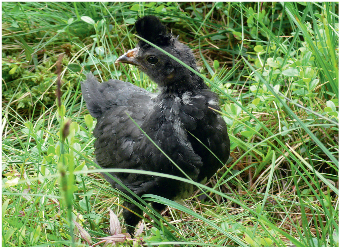
Abb 1 Neunzehn Tage altes Appenzeller Spitzhaubenküken im Testfeld «Mischtyp».

Die Beobachtungssequenzen der Küken fanden zwischen dem 17. Juni und dem 11. Juli 2009 statt. An insgesamt 15 Tagen führten wir die Versuche durch. Dabei setzten wir die Küken an jedem Tag jedem Vegetationstyp mindestens einmal aus.