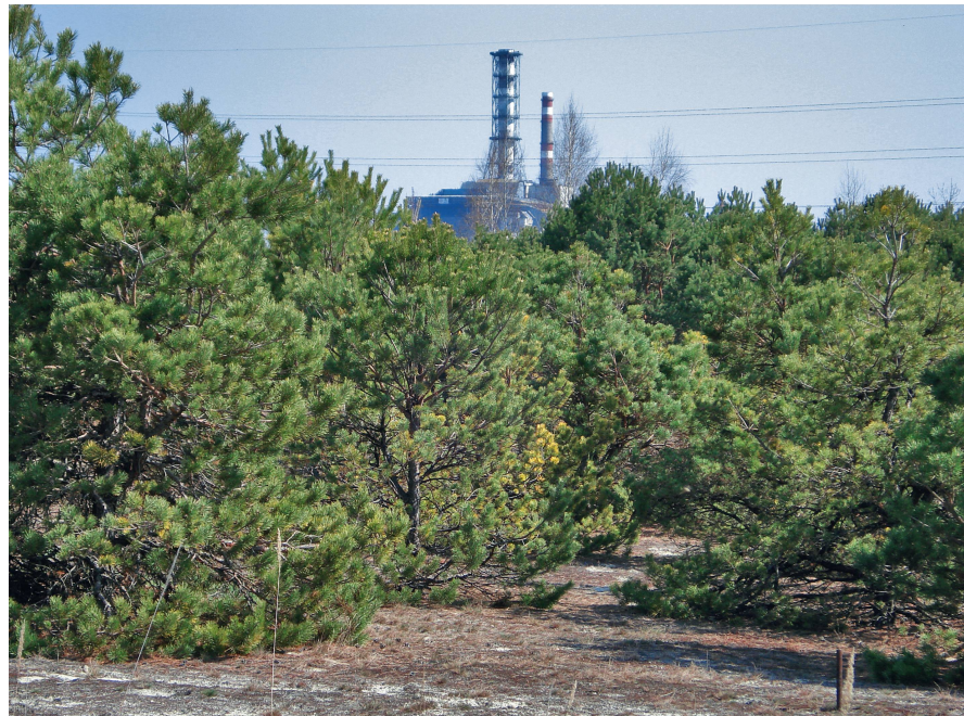
Abb 1 Kiefern ( Pinus sylvestris ) in unmittelbarer Nähe zum explodierten Atommeiler in Tschernobyl (im Hintergrund) zeigen Schadenssymptome, konnten sich aber anpassen.

wie vor die wichtigste Grundlage für die Berücksichtigung der Rolle genetischer Information zum Verständnis der Anpassbarkeit und des Wachstums von Bäumen und Beständen dar.