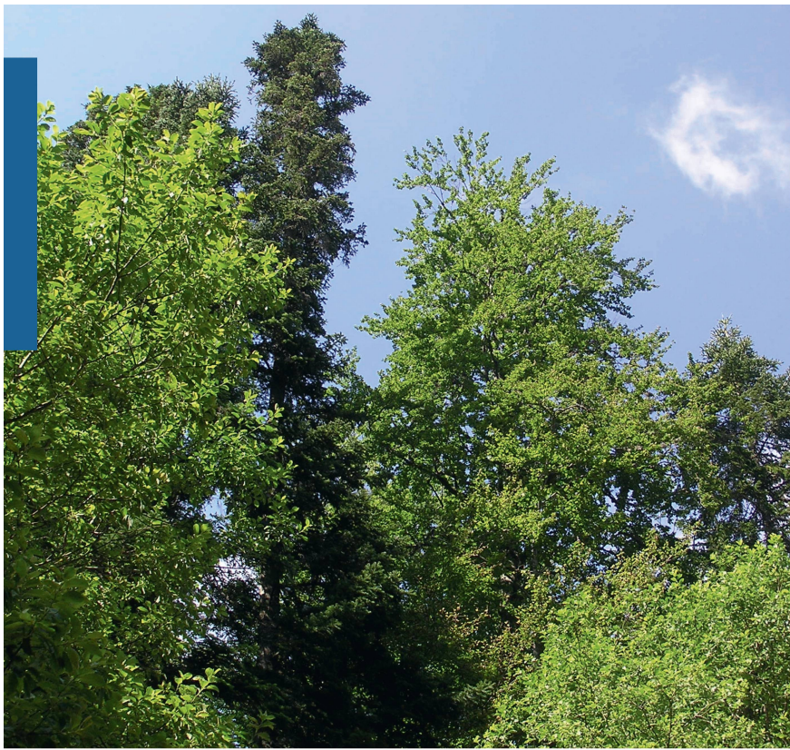
Abb 3 Die Erhaltung und der Schutz forstgenetischer Ressourcen im Süden Europas wird in Anbetracht des prognostizierten Klimawandels auch für die zentraleuropäische Forstwirtschaft bedeutsam. Abgebildet ist ein artenreicher, naturnaher Mischwald im Norden Griechenlands.

erwartet werden, dass die Nutzung und der Schutz forstgenetischer Ressourcen in wärmeren Klimaregionen im südlichen Europa für zentraleuropäische Gebiete bedeutsam werden (Abbildung 3), auch wenn zum gegenwärtigen Zeitpunkt ein weiträumiger Transfer von Vermehrungsgut für Wiederaufforstungen noch nicht empfohlen werden kann. Müller-Starck & Felber (2010, dieses Heft) belegen das verglichen mit anderen Baumarten geringe Potenzial für evolutionäre Anpassungsprozesse bei der Lärche im Alpenraum und stellen vor diesem Hintergrund die Möglichkeiten der Anpassung an den Klimawandel für diese Art infrage.