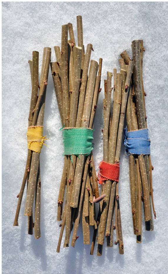
Abb 1 Waldeigentum, dargestellt als nach Besitzer gebündelte Verfügungsrechte.

Die gegenseitige Natur von schädlichen Effekten – Emittent und Empfänger – hat zwei Konsequenzen. Erstens kann es nur zu schädlichen Effek-