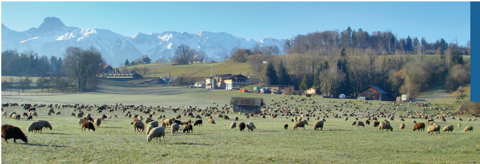
Abb 3 Traditionelle Schafwanderherden ziehen wie hier in Uetendorf im Kanton Bern ohne explizites Einverständnis der Grundeigentümer über Land – ein einfaches und ortsübliches institutionelles Arrangement des Zivilgesetzbuches.

Als Protagonist des Opportunitätskostenansatzes (Coase 1938/1973) ist er der Auffassung, dass dieser nicht nur für Unternehmensentscheidungen, sondern auch für die Maximierung des Sozialprodukts methodisch den Weg weist (Abbildung 3). Für ihn genügt es aber nicht, lediglich die Produktionskosten zu vergleichen, weshalb er einen breiteren Evaluationsansatz empfiehlt.