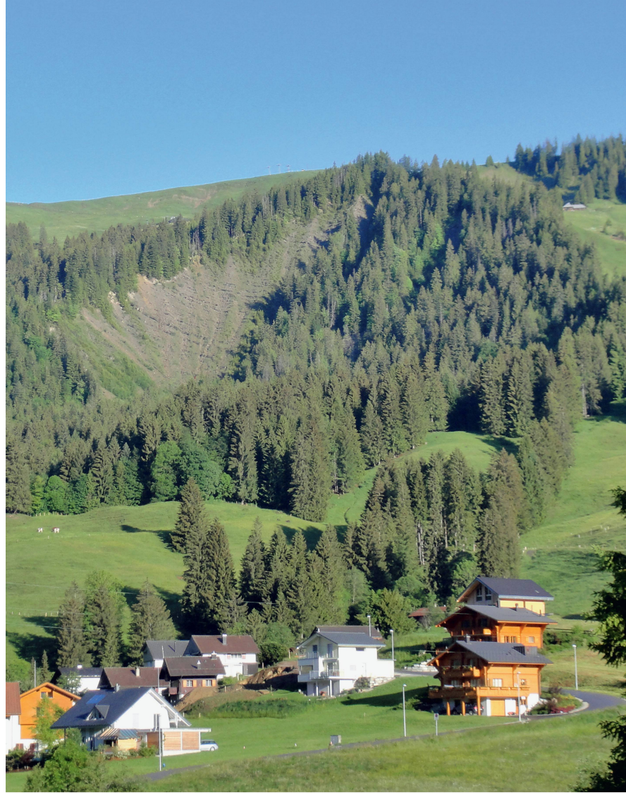
Abb 2 Neue Wohngebiete und Schutzwald in Schwarzsee (Kanton Freiburg): Wer ist der Problemverursacher? Die Ortsplanung mit ihren Schutzbedürfnissen oder die Waldeigentümer, welche (vielleicht) die Stabilität ihrer Wälder geringschätzen?

ten kommen, wenn auch tatsächlich ein Mensch von diesen betroffenen ist (Abbildung 2). Das einsame Rauchen meiner Havanna im Wald stellt kein Umweltproblem dar. Rauche ich sie jedoch im – mit Nichtrauchern – voll besetzten Bahnwagen, dann schon. Zweitens deutet die reziproke Natur des Umweltproblems darauf hin, dass es sich offenbar um einen Konflikt zwischen mir und meinen Mitmenschen handelt (Abbildung 2). Ich schwängere die Luft mit Rauch, meine Mitreisenden wünschen sich qualmfreie Luft. Offenbar ist saubere Luft knapp, aber wem gehört das Verfügungsrecht über die saubere Luft im Bahnwagen nun wirklich? Mir oder den Nichtrauchern?