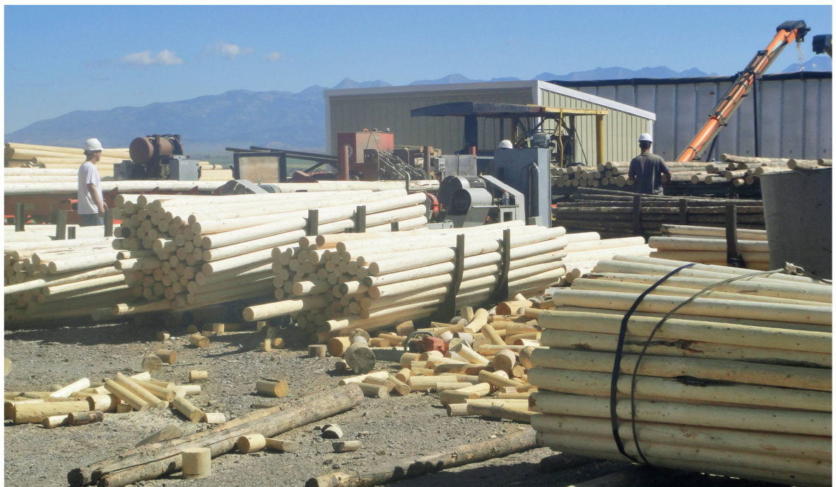
Abb 7 Waldunternehmer in Montana (USA) beim Bündeln von Verfügungsrechten.

sig, die Pigousteuer (Fall 2) als unzweckmässig – jedenfalls in einem Umfeld von geringen TK. Die Überlegungen von Coase helfen jedoch mit, die von Buchanan immer wieder betonten Spielregeln mehr und mehr in den Vordergrund zu rücken. Diese bestimmen darüber, welche gesellschaftlichen Entscheidungsverfahren bei der ständigen Neuordnung von Rechten und der Errichtung von Institutionen zum Zuge kommen. Schlechte Koordinationsleistungen beziehungsweise Koordinationsversagen sind deshalb ursächlich nicht den Institutionen Markt, Firma oder Staat zuzuordnen, sondern vielmehr auf unzweckmässige gesellschaftliche Spielregeln höherer Ordnung beziehungsweise auf ein Demokratie- oder Verfassungsversagen zurückzuführen.