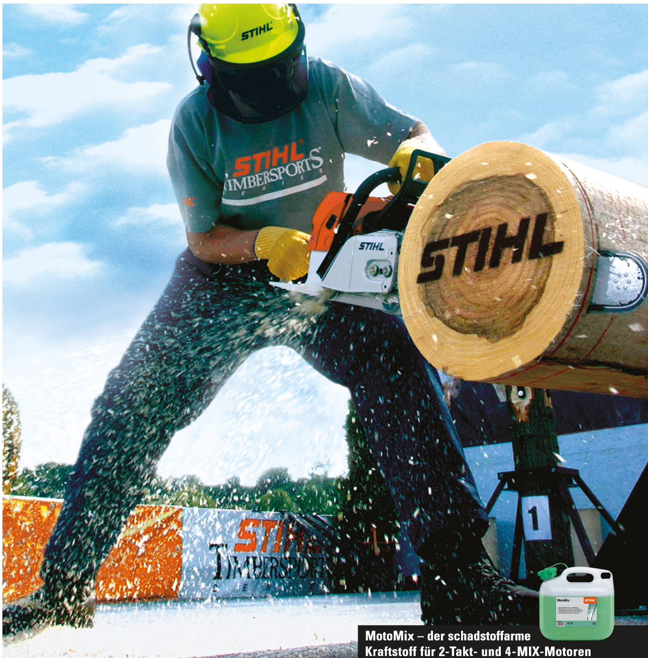
MotoMix – der schadstoffarme Kraftstoff für 2-Takt- und 4-MIX-Motoren