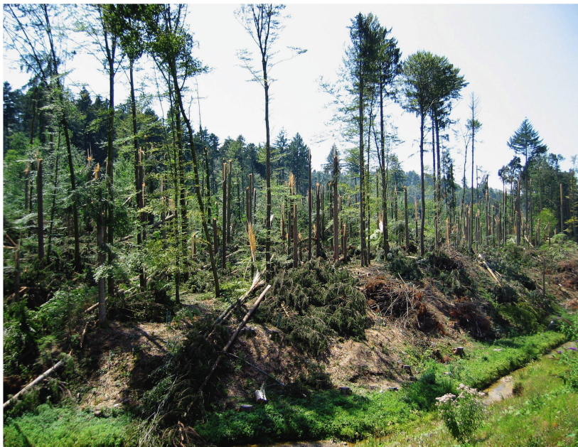
Abb 1 Stammbrüche von Fichten und Buchen nach dem sommerlichen Gewittersturm vom 16. Juli 2003 bei Wangen, Gemeinde Jona (St. Gallen).

ckenperioden während der Sommermonate führen. Die Waldbrandgefahr ist in denjenigen Gebieten am grössten, wo sowohl genügend Niederschläge, die das Wachstum der Vegetation und den Aufbau von Brandgut ermöglichen, als auch vorübergehende Trockenperioden, die dieses Brandgut entzündbar machen, vorhanden sind (Christensen 1993). Bei wärmerem Klima dürften Waldbrände nicht nur auf der Alpensüdseite, wo die Monate Januar bis April während der letzten 30 Jahre trockener geworden sind (Reinhard et al 2005), sondern auch nördlich der Alpen (Schumacher & Bugmann 2006) häufiger werden. Im trocken-heissen Sommer 2003 nahm beispielsweise die Blitzschlaganfälligkeit der Vegetation in den montanen und subalpinen Lagen der (Tessiner) Alpen zu, was das Waldbrandrisiko erhöhte (Conedera et al 2006). Im dicht besiedelten Europa, also auch in der Schweiz, haben Waldbrände aber zu über 90% eine unnatürliche Ursache wie Unachtsamkeit an Feuerstellen oder Brandstiftung (Conedera et al 2006). Die Feuerausbreitung verschärft sich überdies bei Starkwinden, so zum Beispiel während Föhn. Die hier geschilderten Prognosen von Extremereignissen sind allerdings generell mit grossen Unsicherheiten behaftet.