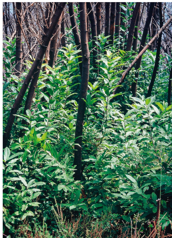
Abb 6 Ausschlagende Kastanien ( Castanea sativa ) nach Waldbrand.

tremereignissen verjüngen, können uns Modellprojektionen geben (siehe Zimmermann & Bugmann 2008, in diesem Heft). Noch unmittelbarer als in solchen schwer interpretierbaren Projektionen zeigt sich jedoch die Wirkung höherer Temperaturen bereits heute zum Beispiel in der Zunahme von immergrünen Pflanzen in Tessiner Wäldern (Walther et al 2002), im Höherwandern der Mistel (Dobbertin et al 2005), in der Ablösung der Waldföhren durch die Flaumeiche im Wallis (Rigling et al 2006) oder in der Invasion von Neophyten auf Blößen in Wäldern tieferer Lagen (Nobis 2008). Auf der Grundlage solcher Beobachtungen können gezielte Experimente zur Baumverjüngung unter limitierten Wuchsbedingungen neue Erkenntnisse liefern. ■