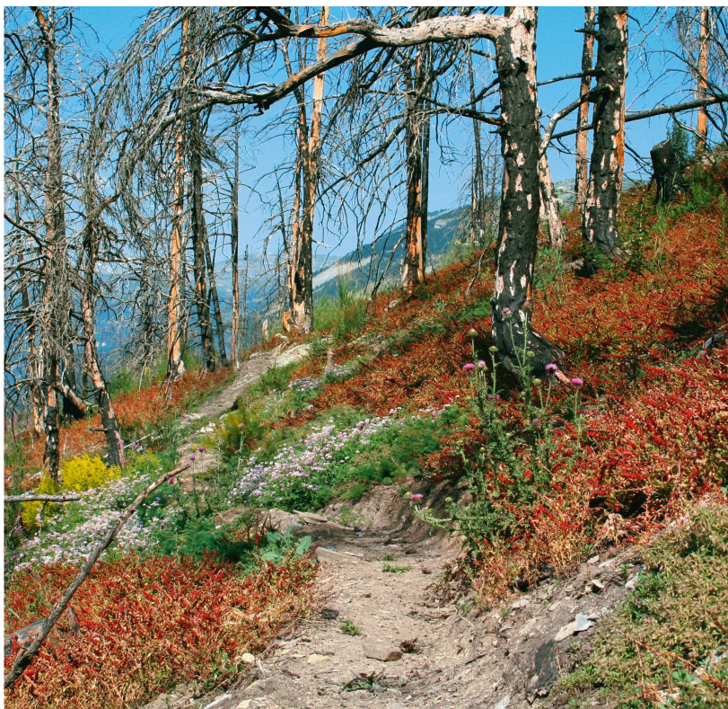
Abb 5 Waldbrandfläche von Leuk (Wallis) drei Jahre nach dem Brandereignis vom 13. August 2003 mit Erdbeerspinat ( Blitum virgatum L.). In den trockenen Tieflagen kommt die Verjüngung von Baumarten nur schleppend voran.