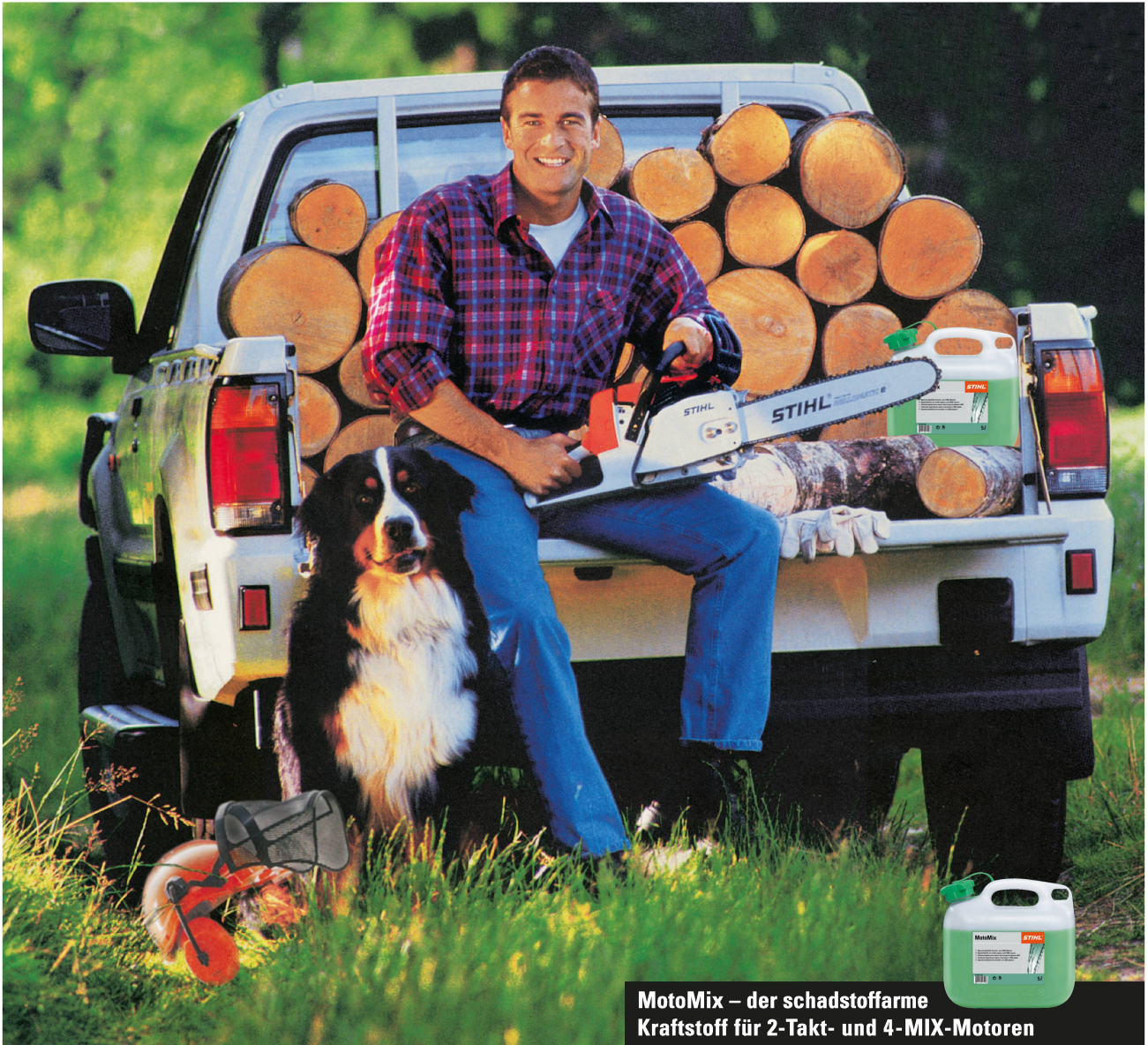
MotoMix – der schadstoffarme Kraftstoff für 2-Takt- und 4-MIX-Motoren