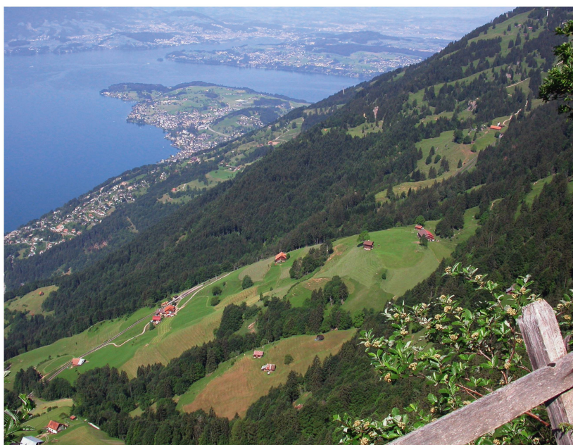
Abb 3 Blick von der Rigi auf Weggis hinunter: Auf kleinem Raum finden sich im Kanton Luzern viele verschiedene Waldgesellschaften.

sechs auf fünf Forstkreise. Es wurden ein überbetriebliches Holzvermittlungssystem (Lenca AG) aufgebaut und regionale Organisationen gebildet. Damit erfolgte eine erneute Verlagerung von Förststellen. Gleichzeitig wurden die Stellen des höheren Forstkaders von ursprünglich 13 (1996) auf heute neun reduziert. Im Sommer 2006 wurden aus den fünf Forstkreisen drei Waldregionen gebildet. Ab Sommer 2008 werden im Kanton voraussichtlich noch 18 Forstreviere bestehen. Beim Staatsforstbetrieb, der 1996 noch aus sechs Betriebsgruppen mit 32 Betriebsmitarbeitern bestand, erfolgte bis 2002 eine Halbierung des Mitarbeiterbestandes (zwei Betriebsgruppen). Heute arbeitet der Staatsforstbetrieb unter einer Führung.