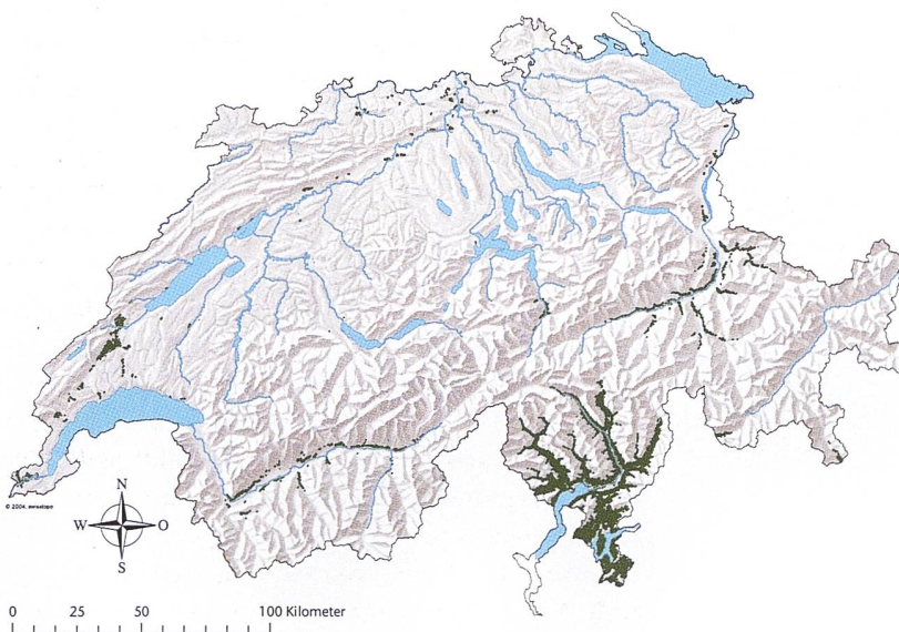
Abb 2 Eichenwälder als potenziell natürliche Vegetation (grün).

Der Mittelspecht wurde auf einer Fläche von rund 19 300 ha (1.8% der Schweizer Waldfläche) festgestellt. Über 50% der Waldfläche mit Mittelspechtvorkommen liegen in den Kantonen Basel-Landschaft, Zürich, Thurgau, Schaffhausen (Abbildung 3, Tabelle 3). Weitere Kantone mit Mittelspechtvorkommen sind: Solothurn, Aargau, Jura, Neuenburg, Waadt, Bern, Basel-Stadt, Genf, Luzern und Freiburg. Keine Mittelspechtvorkommen finden sich in den Kantonen Appenzell Innerrhoden und Ausserrhoden, Glarus, Graubünden, Nid- und Obwalden, St. Gallen, Schwyz, Tessin, Uri, Wallis und Zug.