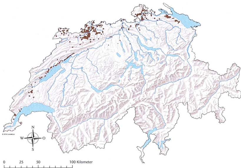
Abb 3 Wälder mit Mittelspechtvorkommen (braun).