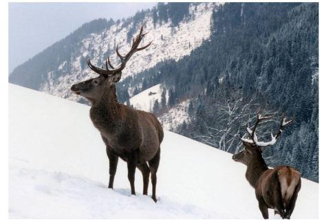
Das saisonal wandernde Rotwild reagiert auf Freizeitaktivitäten.

Veränderungen in unserer Gesellschaft haben oft auch Folgen für natürliche Abläufe. Dies fordert nach erweiterten und neuen Fragestellungen. Die Arbeitsgruppe Wald und Wildtiere des Schweizerischen Forstvereins zeigte mit der Wald-Wild-Weiterbildung 2007, wie sich Entwicklungen im menschlichen Verhalten auf Wildtiere auswirken können.