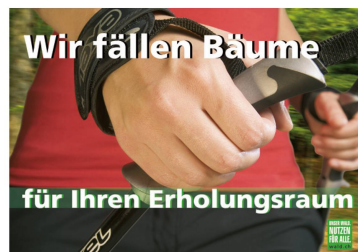
Eines der sieben Plakate der Imagekampagne.

«Unser Wald. Nutzen für alle.» heisst der Slogan einer neuen Imagekampagne für den Schweizer Wald und die Forstbranche, welche kürzlich von Waldwirtschaft Schweiz (WVS), dem Verband Schweizer Forstpersonal (VSF) und dem Verband Schweizerischer Forstunternehmungen (VSFU) gemeinsam lanciert wurde. Mit der Kampagne soll die Bevölkerung dafür sensibilisiert werden, dass der Wald für die Sicherstellung der vielfältigen Ansprüche in der Regel auch bewirtschaftet werden muss.