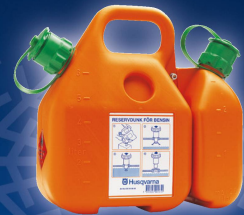
KOMBIKANISTER Fr. 65.-