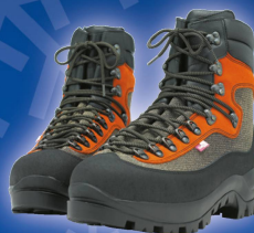
FORSTSCHUH PROLINE Fr. 348.-