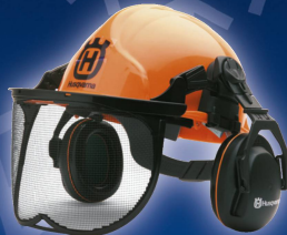
SCHUTZHELM Fr. 89.-