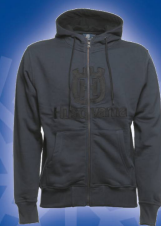
KAPUZENJACKE Fr. 88.-