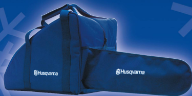
MOTORSÄGENTASCHE Fr. 49.-