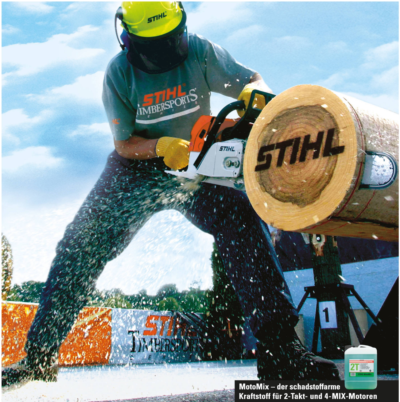
MotoMix – der schadstoffarme Kraftstoff für 2-Takt- und 4-MIX-Motoren