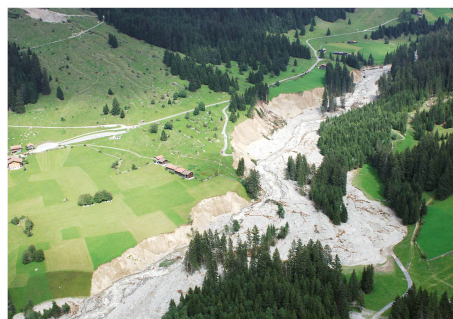
Unwetter 2005 im Raum Klosters.