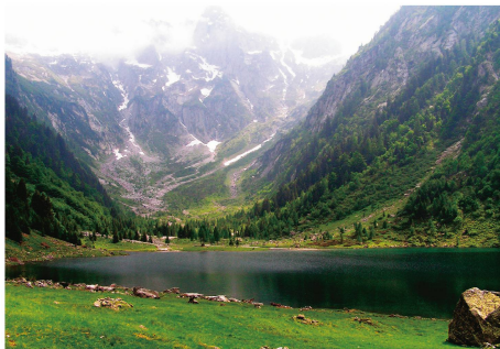
Mitten im neuen Waldreservat: der idyllische Cama-See.

Im Misox ist das grösste Waldreservat der Schweiz ausserhalb des Nationalparks geschaffen worden. Mitte Oktober haben die Standortgemeinden, Pro Natura und der Kanton Graubünden den Schutzvertrag unterzeichnet. Das Reservat im Val Cama und im Val Leggia umfasst eine Fläche von 15 km 2 . Davon sind rund zwölf km 2 Naturwaldreservat und rund drei km 2 Sonderwaldreservat. ■