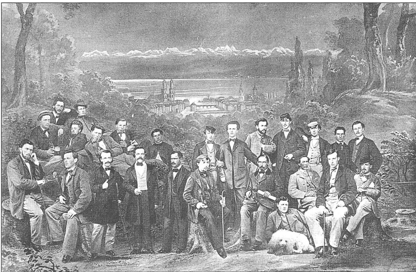
Abbildung 1: Die Forstschule als Institution und Ausbildungsstätte.

Es sind freilich nicht nur die Bezeichnungen, die sich im Laufe der Zeit verändert haben. Geschichte findet an Orten (KNUCHEL 1925, 1927) und in einem bestimmten gesellschaftlichen Kontext statt (BURRI & WESTERMANN 2005). Deshalb lässt sich die ehemalige «Forstschule» der ETH mit unterschiedlichen Bildern verknüpfen. Auffällig ist in der Literatur, dass die Bezeichnung «Forstschule» weit über 1908 hinaus verwendet wurde, dem Zeitpunkt, als die Abteilung VI Forstwirtschaft der Eidgenössischen Technischen Hochschule geschaffen