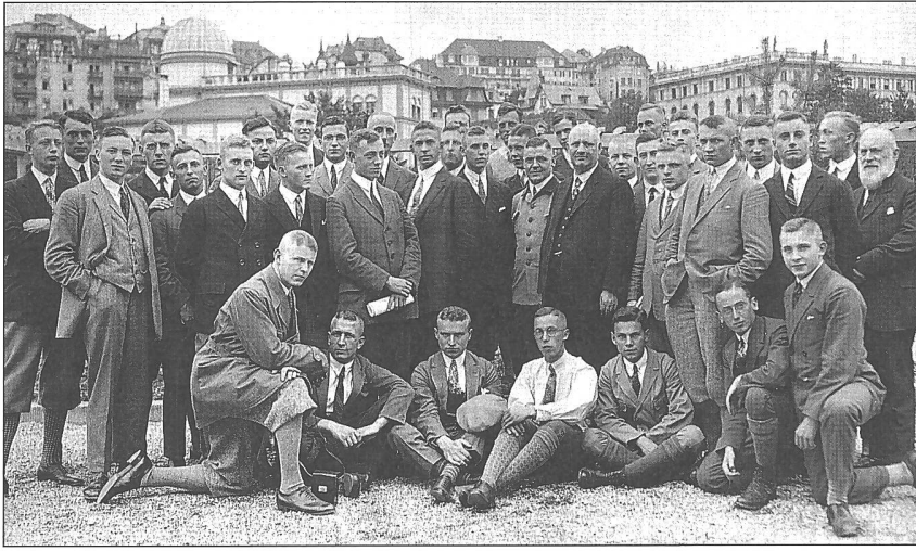
Abbildung 3: Die Forstschule von jenseits der Grenze.

Im Juli 1927 waren Gäste der Forstschule Freiburg im Breisgau zu Besuch bei ihrer Schwesterinstitution an der ETH Zürich. Gäste und Vertreter der Eidg. Forstschule (u. a. halbverdeckt Prof. H. Knuchel in der hintersten Reihe, Mitte) haben sich dannzumal auf dem Dach des Instituts für Land- und Forstwirtschaft ablichten lassen. Im Hintergrund links erkennt man zudem das Gebäude der Eidg. Sternwarte, aus deren Keller im Jahre 1990 wegen geplanter Renovationsarbeiten die Bildsammlung Prof. Knuchel des Fachbereichs Holzkunde und Holztechnologie an die WSL in Birmensdorf gelangte.