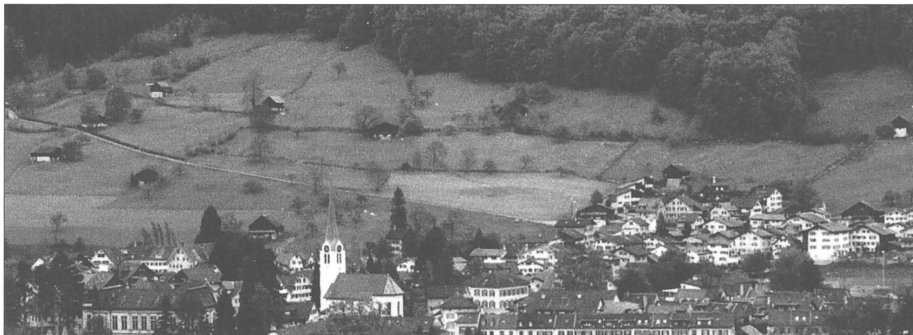
Abbildung 1: Gebiet Ennetrösligen, Gemeinde Ennenda. Aufgenommen im Mai 1997.

Die drei dargestellten Beispiele zeigen die wichtige Funktion der kommunalen Behörden im Kanton Glarus. Sie haben