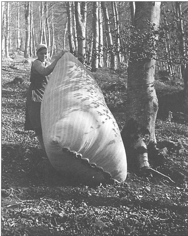
Abbildung 4: «Bettlauben im Gonzenwalde ob Sargans. Die gefüllten Laubsäcke werden den Hang hinunter geworfen, wo sie in munteren Sprüngen den Halteplatz des Wagens erreichen.»

In Werdenberg war das Laubsammeln nur für die Ortsbürger gratis – andere mussten eine Taxe bezahlen (HUGGER, zitiert in GABATHULER 2003). Aus den Reglementen und Wirtschaftsplänen geht hervor, dass dies zum Beispiel in Sevelen, Grabs, Frumsen, Lienz, Buchs und Wartau (hierzu GABATHULER 2003) der Fall war. Auch die Laubkarten belegen die Praxis der Nutzungsgebühr ( Abbildung 2 ). In Sennwald mussten gar alle einen Ausweis besitzen, um lauben zu dürfen (GABATHULER