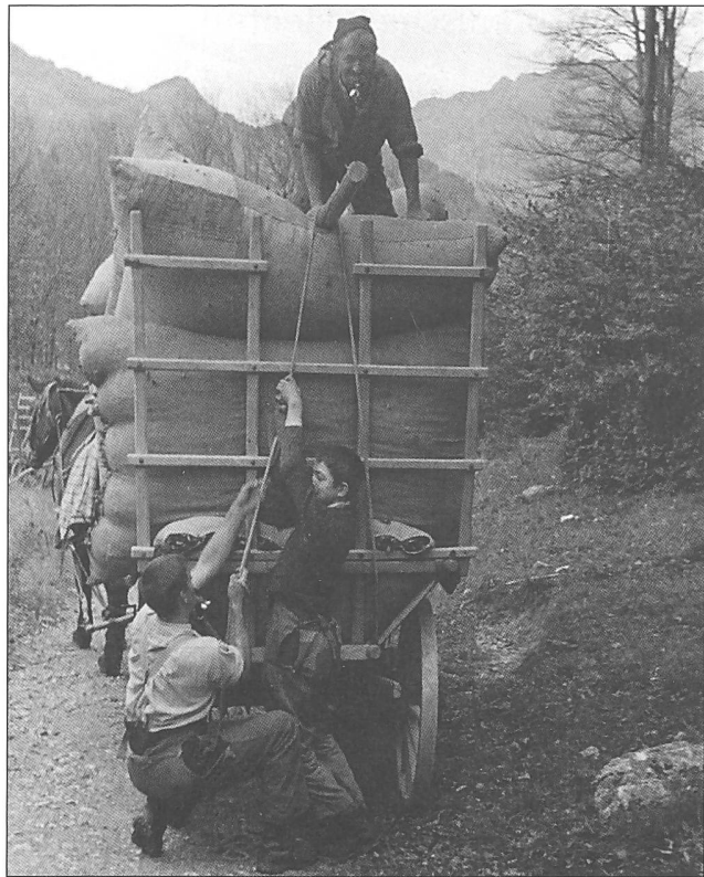
Abbildung 5: «Das Bettlauben im Gonzenwald. Das Laubsackfuder wird festgebunden.»

Um 1940, F. Moser-Gossweiler, Romanshorn. Privatchiv M. Bugg, Berschis.