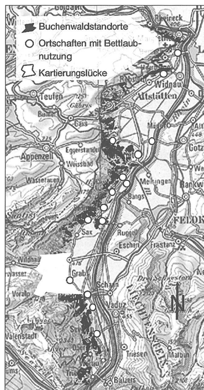
Abbildung 1: Verbreitung des Bettlaubsammelns im Untersuchungsgebiet.

In dieser Arbeit wurde die Methode der Oral History angewendet, bei der die Inhalte mündlicher Überlieferung ausge-