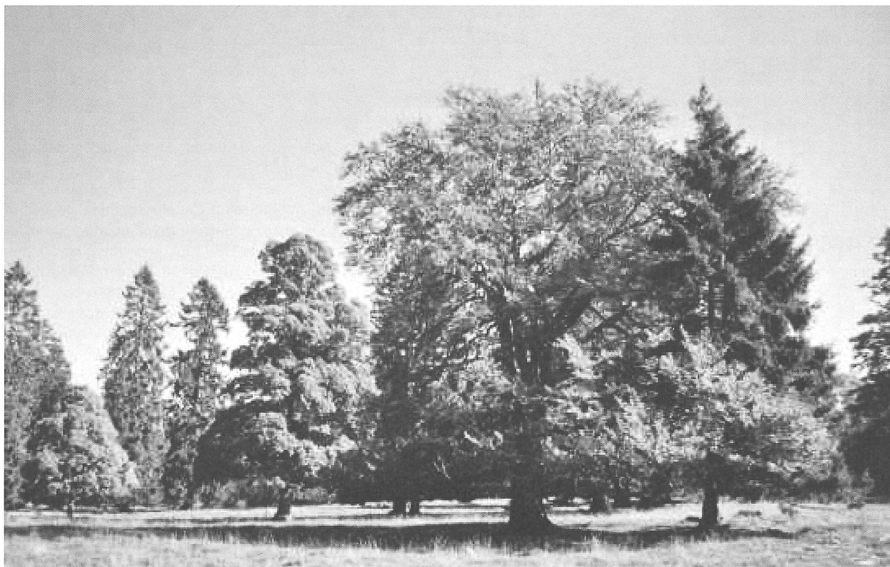
Figure 2: Forêt communale de Fontainemelon: pâturage boisé des Loges.

L'excursion débutera à la Vue des Alpes, col de 1283 m d'altitude qu'empruntèrent le 1 er mars 1848 les révolutionnaires commandés par Fritz Courvoisier et Ami Girard pour se rendre du Locle au château de Neuchâtel et instaurer la République. On se rendra ensuite à Tête de Rang, en traversant les pâturages boisés de différents propriétaires sous le regard de quelques beaux et vénérables sycomores, avec une magnifique vue sur les Alpes tout au long du parcours. Nous nous transporte-