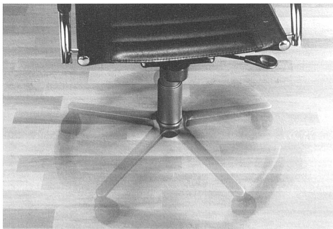
Abbildung 1: Charakterisierung der Verschleisseigenschaften mittels Stuhlrollentest (Foto: Bauwerk AG).

Beim Produkt Denspark, einer zweischichtigen Konstruktion zur vollflächigen Verklebung, wird die Decklamelle (4 mm) polymerisiert. Die Trängung erfolgt in üblichen Imprägnier-