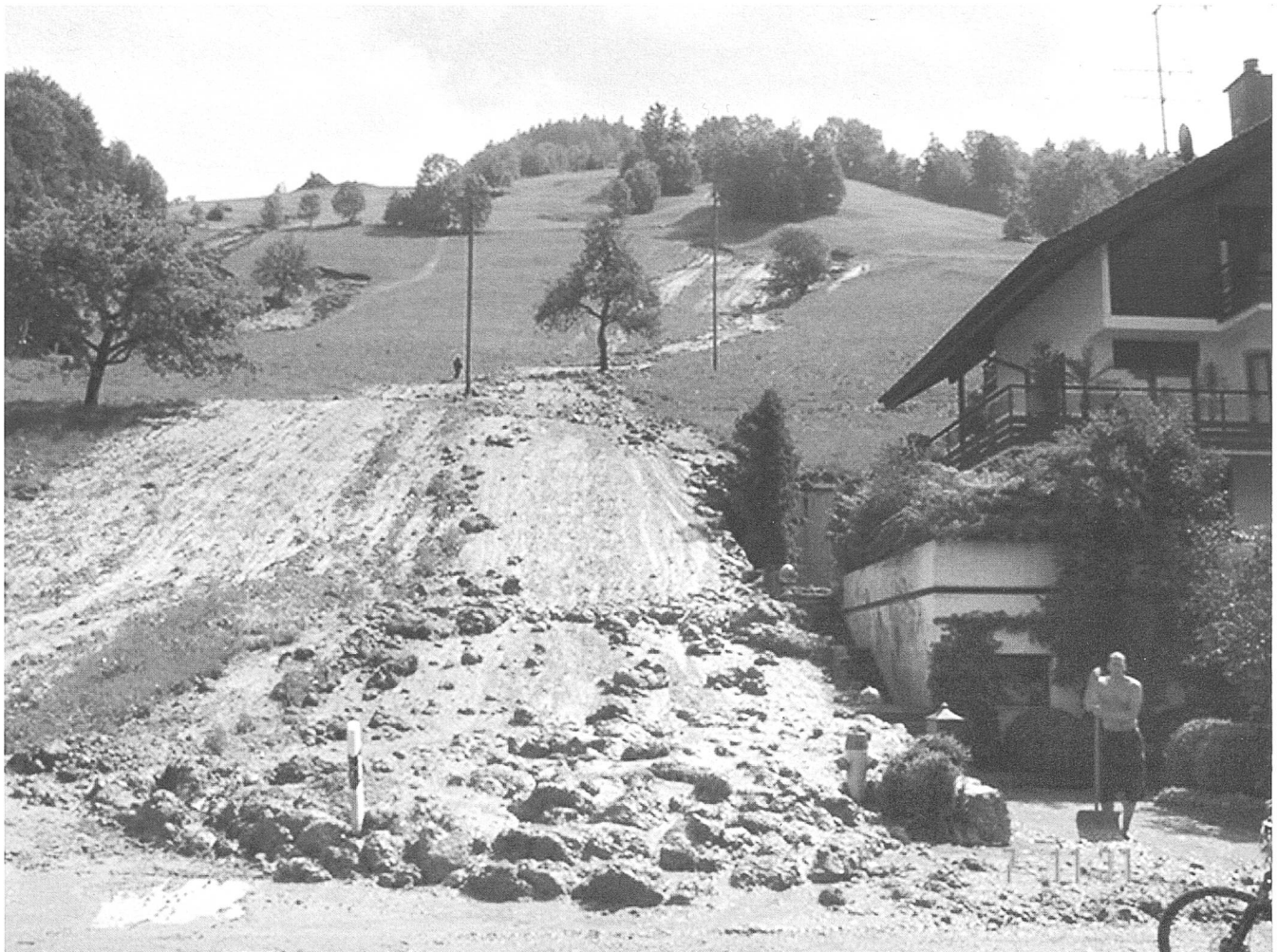
Abbildung 1: Beim Unwetter vom 6. Juni 2003 in Oberägeri lösten sich rund 150 Hangmuren.

Im Kanton Zug sind zahlreiche Naturgefahren-Ereignisse bekannt. Zu erwähnen sind beispielsweise die Seeuferrutschungen der Jahre 1435 und 1887, bei welchen ein Teil der Zuger Altstadt auf den strukturempfindlichen Seekreideböden absackte (STADT ZUG 1987). Das erste Hochwasser-Ereignis, welches im Ereigniskataster erwähnt wird, ist die Überflutung der Stadt Zug durch den heutigen Burgbach am 4. August 1542 (KANTONSFORSTAMT ZUG 1994). Grosse Überschwemmungen, verbunden mit Hangrutschen, sind aus den Jahren 1874, 1910, 1934 und 1976 bekannt. Im Frühjahr 1999 führte der extrem hohe Seestand von Zugersee und Ägerisee zu Schäden infolge Überflutungen, im Mai 1999 lösten sich infolge lang anhaltender Niederschläge über 100 Hangrutsche. Am 6. Juni 2002