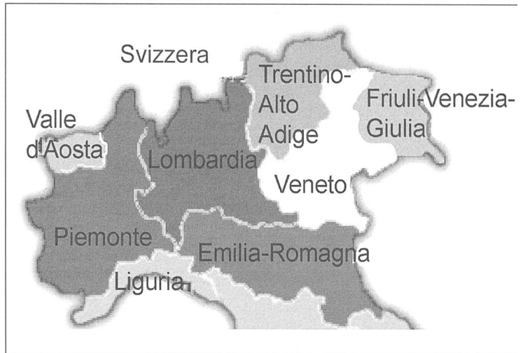
Abbildung 1: Die Regionen Norditaliens.

Die zu den untersuchten Aspekten gefundenen Daten der italienischen Planungen werden mit den Grundsätzen der schweizerischen Planung verglichen und gefundene Unterschiede oder Gemeinsamkeiten bewertet. Für die Bewertung der erfassten Daten sind Vergleichsmaßstäbe nötig, an denen