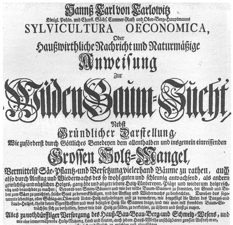
Abbildung 1: Titelblatt der Sylvicultura Oeconomica von Hanns Carl von Carlowitz.

«Wird derhalben die grösste Kunst, Wissenschaft, Fleiss und Einrichtung hiesiger Lande darinnen beruhen, wie eine sothane Conservation und Anbau des Holzes anzustellen, dass eine continuirliche beständige und nachhaltige Nutzung gebe, weiln es eine unentberliche Sache ist, ohne welche das Land in seinem Esse nicht bleiben mag». Gemäss von Carlowitz ist also die Planung und die nachhaltige Holznutzung des Waldes für den Staat unentbehrlich und existentiell. Auch weist von Carlowitz auf die Bedeutung der rechtzeitigen Planung hin, wenn er schreibt, «dass es zu lange geharret sey, wenn man allererst soll sparen, wenn es auf die Neige gekommen».