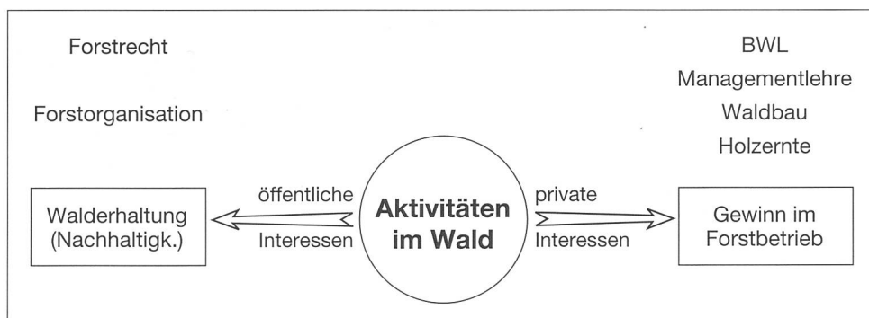
Abbildung 2: Unterschiedliche Interessen an der Ressource Wald.