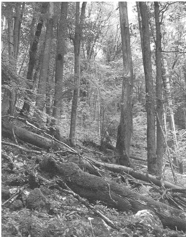
Abbildung 3: Totholzreiche Teilflächen im Naturwald Gorges de Court, wo mit Rosalia alpina (Linnaeus, 1758) ein xylobionter, europaweit gefährdeter Bockkäfer vorkommt.

Potenzial für totholzabhängige Lebewesen wird über längere Zeit mittelmässig bleiben, da zwar zunehmend Licht, aber kaum Laubtotholz anfallen wird.