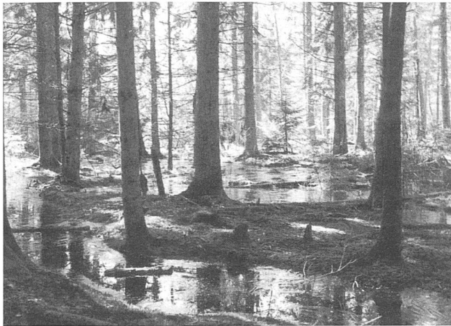
Abbildung 2: Wiedervernässung im aufgeforsteten Teil des Naturwaldes Heidi.

In den nächsten Jahrzehnten wird zunehmend Nadeltotholz anfallen – vor allem stehend und in schwachen bis mittleren Dimensionen. Ein Wert von > 30 m 3 /ha wird aber voraussichtlich nur erreicht werden, wenn Sturmereignisse oder Epidemien die bereits geschwächten Fichten zusätzlich angreifen. Das