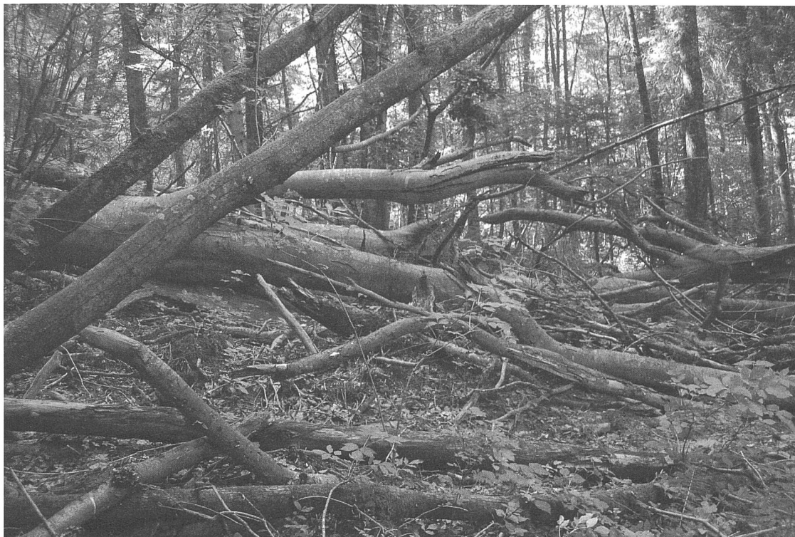
Abbildung 1: Totholzstrukturen im Naturwald Flüegraberain.