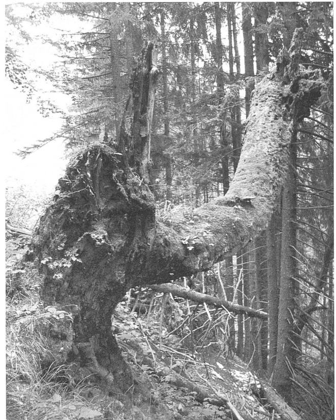
Abbildung 4: Urwaldähnliche Strukturen im Naturwald Weissenburg.

Die steilen Schluchtwälder unterhalb des Zusammenflusses von Morgeten- und Buuschenbach können mehrheitlich dem Eiben-Buchenwald zugeordnet werden. Der Anteil an Totholz ist unterdurchschnittlich. Dieses sammelt sich mehrheitlich im Bachgraben, von wo es gemäss Vertrag für Unterhaltmassnahmen entfernt werden kann. Auch der Altholzanteil umfasst zur Zeit weniger als drei Bäume pro Hektare; andererseits gibt es einzelne Eiben mit teilweise > 30 cm BHD. Im oberen Teil