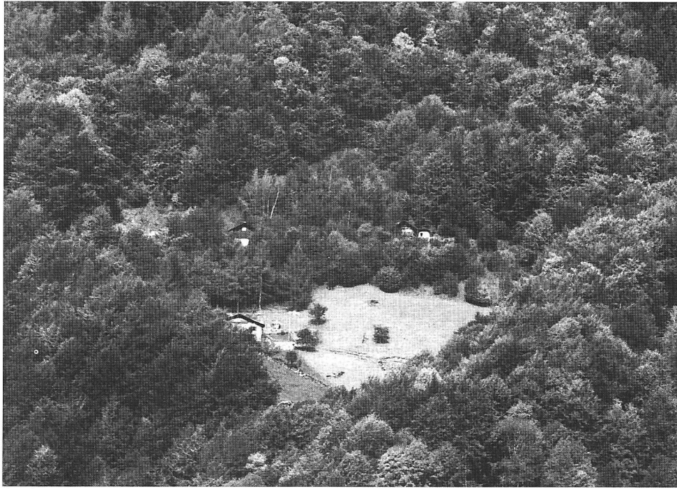
Abbildung 1: Verbuschung oberhalb des Dorfes Gündlichswand.