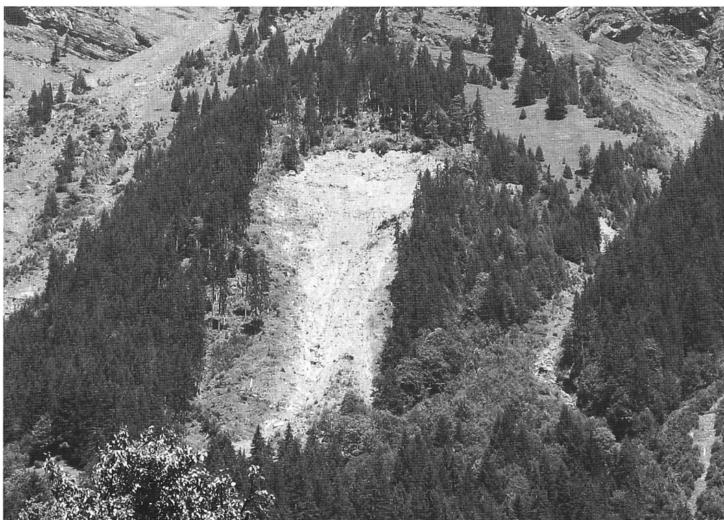
Abbildung 4: Hangrutschung in Burglauenen, Gemeinde Grindelwald.

Im Jahr 1986 gründeten alle neunundzwanzig Gemeinden der Region Oberland-Ost den Gemeindeverband für die Erhaltung der Wälder in der Region Oberland-Ost (Gewo). Dabei spielte der Gedanke der Solidarität zwischen den Gemeinden und den Waldbesitzern eine wichtige Rolle. Für viele Waldbe-