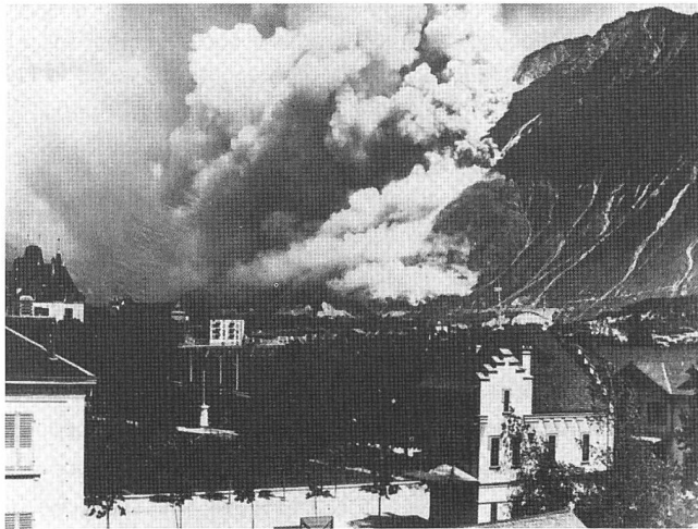
Abbildung 3: Der Waldbrand Ochsenboden im Juli 1921, von Sierre aus gesehen.