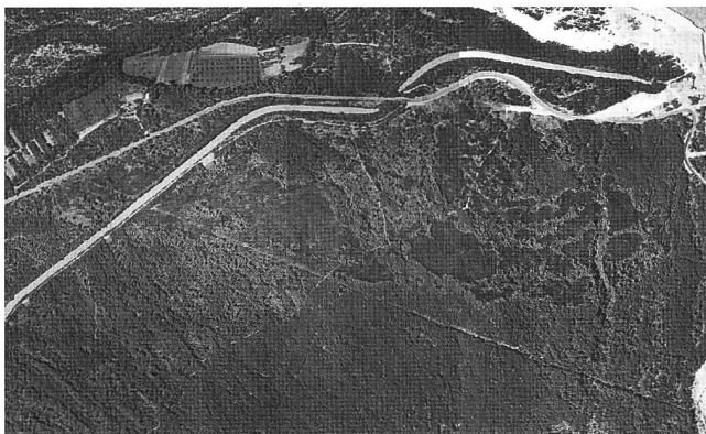
Abbildung 5: Luftbildaufnahme der Schäden vom Waldbrand im Pfywald vom Juli 1962.