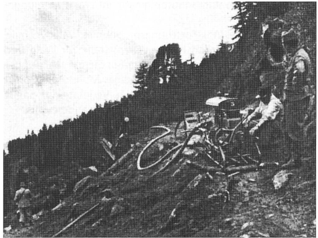
Abbildung 4: Angehörige der Armee im Einsatz mit einer Motorspritze beim Waldbrand Aletschwald/Riederhorn 1944.

Der Pfywald, am linken Rhoneufer zwischen Leuk und Sierre gelegen, kann als eigentlicher «hot spot» für Waldbrände im Wallis bezeichnet werden. Bereits für das 18. und 19. Jahrhundert können einige Brandereignisse nachgewiesen werden (KEMPF & SCHERRER 1982). Anhand ausgeählter Holzkohlepartikel aus Sedimentbohrkernen aus dem Pfafforetsee vermutet BENDEL (2001), dass im Pfywald Waldbrände im 20. Jahrhundert häufiger aufgetreten sind als im 19. Jahrhundert. Zwischen 1902 und 1999 sind mehrere Dutzend Brandfälle belegt. Der grösste Waldbrand im 20. Jahrhundert brach am 11. Juli 1962 aus, nachdem seit April 1962 die Niederschlagsmengen unterdurchschnittlich geblieben waren. Das Feuer fand in der ausgetrockneten Vegetation rasch Nahrung. Insgesamt 42 ha des einzigartigen Föhrenwaldes im Pfywald waren vom Feuer betroffen, wobei 23 ha vollständig zerstört wurden (Abbildung 5). Die Brandfläche beschränkte sich auf das Gemeindegebiet von Leuk.