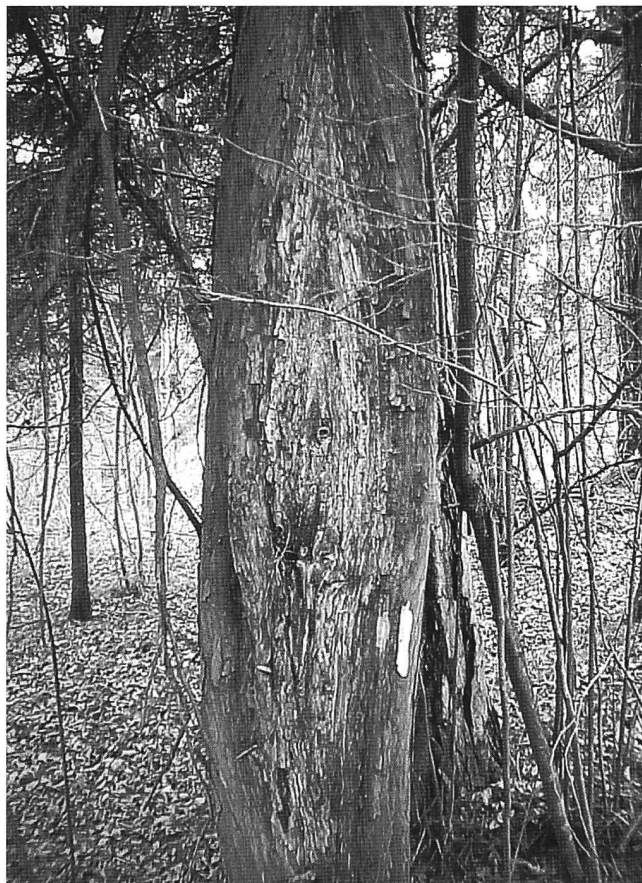
Abbildung 1: Ausgedehnter offener Krebs an einem Eibenstamm im Fürstenwald bei Chur.

Die Krebsbildung, welche bei den Eibenvorkommen im Churer Fürstenwald zu beobachten ist, scheint in den meisten Fällen von abgestorbenen Ästen auszugehen und breitet sich von dort über die Rinde am Stamm aus. Meist bricht die Störung 1 m bis 1,5 m über dem Boden aus, wobei das Kambium und der Bast laufend zerstört werden. Der Stammkrebs breitet sich stärker vertikal als horizontal aus, was zu spitz elliptischen