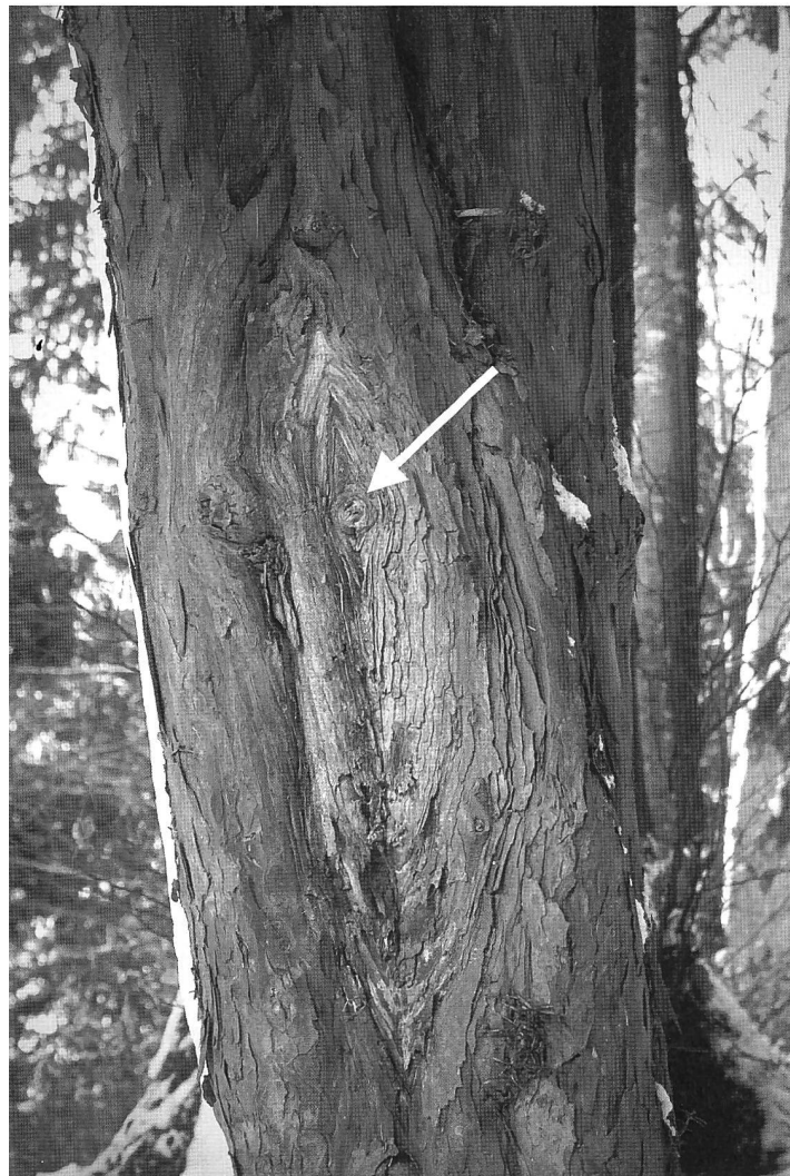
Abbildung 3: Stammkrebs an einer Eibe auf dem Üetliberg bei Zürich. Im Zentrum des Krebses ist der Rest eines Totastes sichtbar (Pfeil), durch welchen möglicherweise die Infektion erfolgt ist.