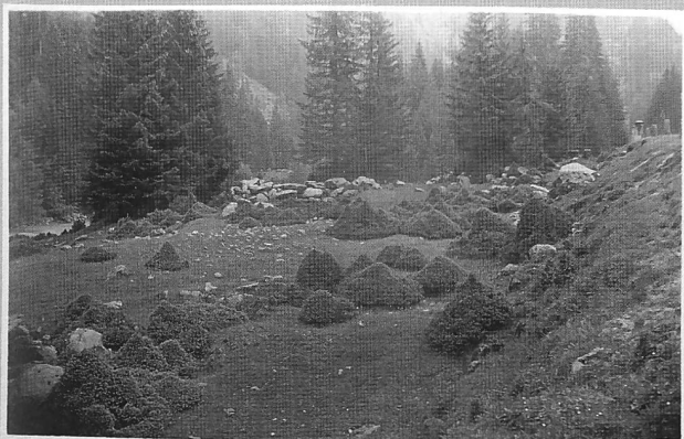
Durch Ziegenweide verstränzelte Rottannen.