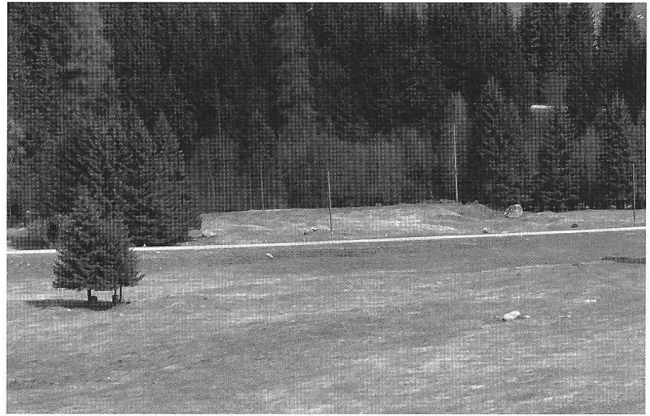
Abbildung 3: Blick auf Weide und Wald längs der alten Splügenstrasse bei der (weggeräumten) Sufner Schmelzi (8. Mai 2004).

Hauptachse war schon damals die von Kreisförster Schwegler erwähnte Splügenstrasse Richtung Hinterrhein. Diese hat seither im Talabschnitt verschiedene Ergänzungen und Ausweitungen erfahren, so dass gegenwärtig die Nationalstrasse A 13 mit dem San Bernardino-Tunnel für den internationalen Güter- und den Nord-Süd-Personenreiseverkehr häufiger erwähnt wird. Die von den Bündner Wanderwegen markierte «Via Spluga» (auch «Römerweg» genannt) führt dort von der Roflaschlucht her auf der linken Seite des Flusses an der Crestawald-Festung vorbei nach Sufers und Splügen. Die Verbindung nach Italien spielte auch für die industriegeschichtliche Nutzung des Raumes durch die «Sufner Schmelzi» eine Rolle.