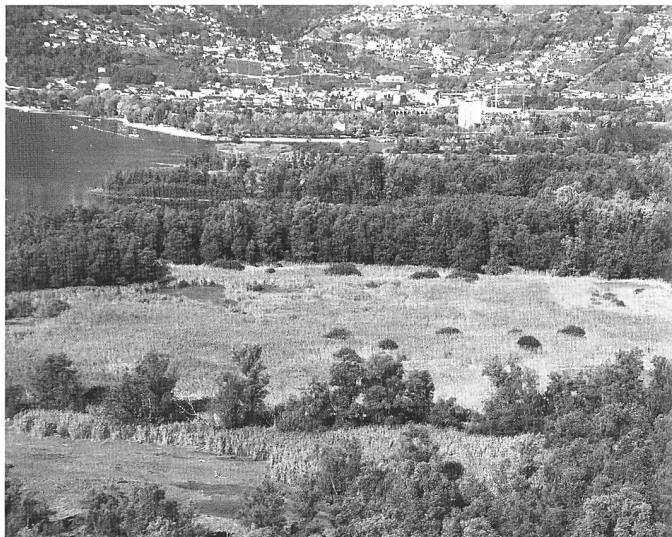
Figura 2: Paesaggio autunnale (2003) con livello del lago basso della parte meridionale e centrale della riserva delle Bolle di Magadino.