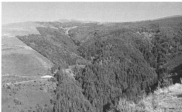
Figura 3: Importante effetto del rimboschimento (sopra Rompiago nel 1943, sotto Rompiago nel 2000).