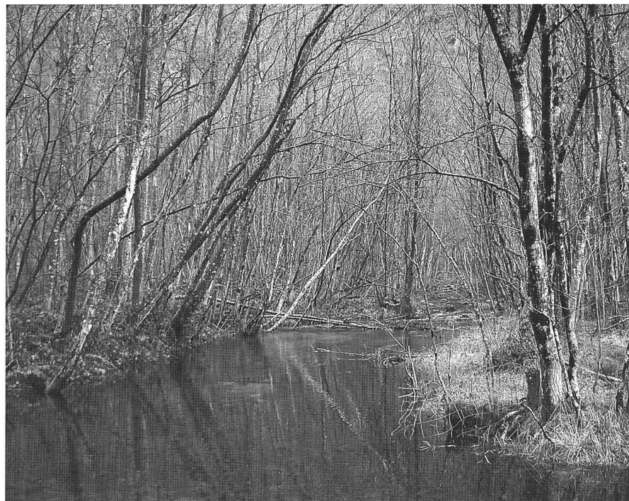
Figura 5: Zona golenale d'importanza nazionale, oggetto 227 Sonlerto – Sabbione. Bosco golenale-planeziale di ontano bianco, località Rivera (tra Roseto e Faedo).

Obiettivo dell'escursione è presentare le proposte operative contenute nel Piano e gli interventi previsti a seconda del tipo di settore (figura 5).