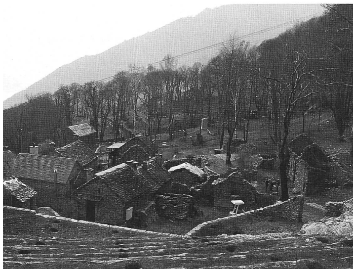
Figura 1: Veduta del nucleo di Curzùtt in fase di ristrutturazione.

Le Bolle di Magadino sono uno dei 9 paesaggi golendali svizzeri ritenuti di importanza internazionale soprattutto per il