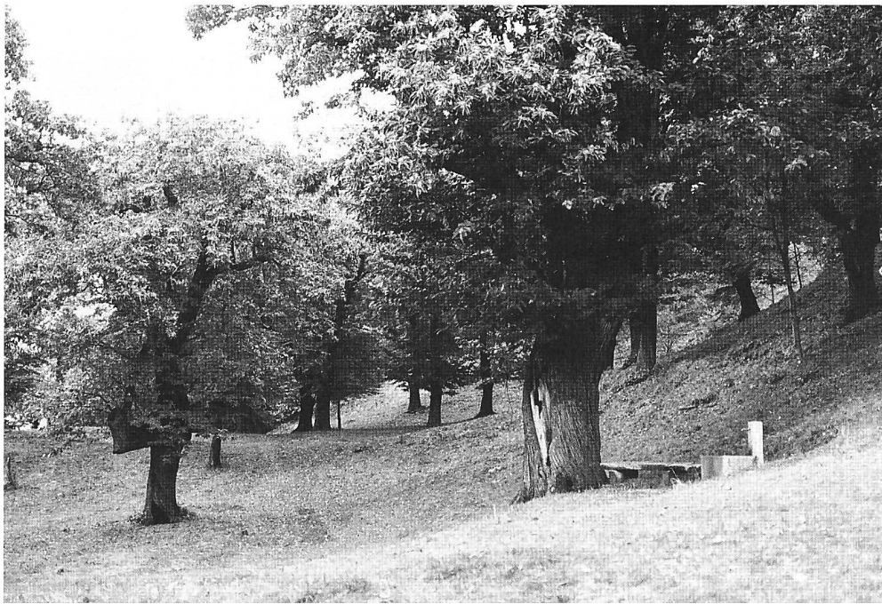
Figura 4: Selva di Induno, proprietà del patriato di Arosio; in primo piano si vede un castagno ultracentenario della varietà Tenasca.

Caucaso. In Europa centrale è presente solo sporadicamente. La coltivazione del castagno ha origine remota. Già praticata al tempo degli antichi romani, è stata di grande importanza per molti secoli nella regione dei laghi al Sud delle Alpi. Il frutto costituiva una fonte di sostentamento per le popolazioni locali, il legname era usato per la costruzione e per riscaldamento, il tannino contenuto nel legno per la concia delle pelli, le foglie quale strame e nelle luminose selve pascolava il bestiame (figura 4). Con la diffusione nelle campagne europee del mais e della patata, l'importanza della castagna quale alimento diminuì. L'arrivo della ferrovia a fine ottocento, comportò la progressiva sostituzione del legno di castagno con altri legnami, materiali e vettori energetici. Con la fine della seconda guerra mondiale, la castanicoltura fu in sostanza abbandonata. Negli anni cinquanta la specie è stata colpita dal cancro corticale, malattia causata da un fungo, che ha ulteriormente diminuito il valore dei boschi castanili.