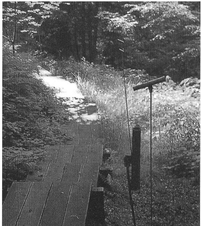
Abbildung 1: Seelensteg in Heiligkreuz (Foto: M. Scherer).