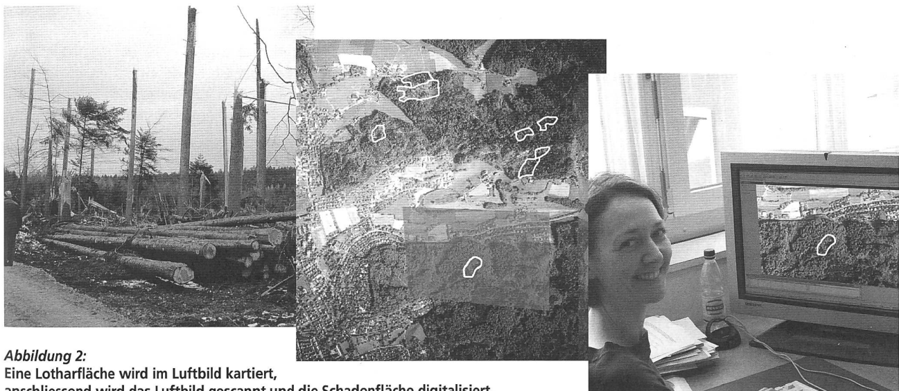
Abbildung 2: Eine Lotharfläche wird im Luftbild kartiert, anschliessend wird das Luftbild gescannt und die Schadenfläche digitalisiert.

Damit der Bund die Daten des Kantons Aargau übernehmen konnte, mussten verschiedene Bedingungen erfüllt werden, was eine zusätzliche Koordination erforderte. Trotzdem wurde der Zeithorizont bis zum Abschluss des Projektes sehr eng gesetzt. Startpunkt war im Mai 2000 nach Erhalt der Luft-