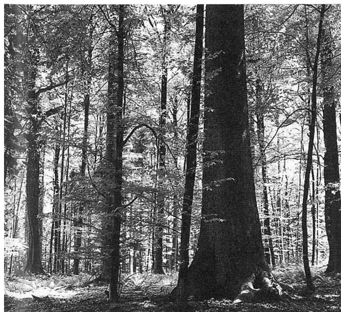
Abbildung 3: Lütisbuech: Dickste, leider dem Borkenkäfer zum Opfer gefallene Fichte des Kantons Aargau.