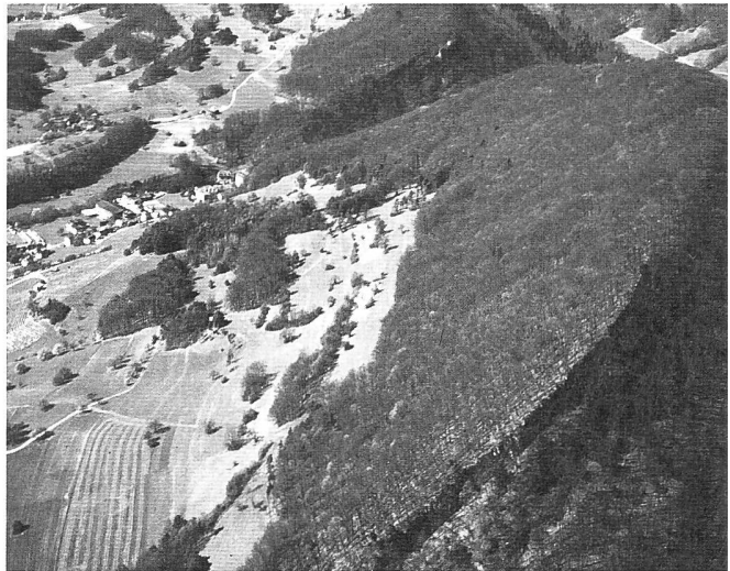
Abbildung 2: Der Acheberg: Teil des grössten zusammenhängenden Naturwaldreservates des Kantons Aargau.