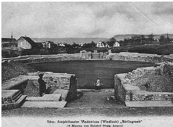
Röm. Amphitheater Vindonissa (Windisch) „Bärligrueb“ (10 Minuten vom Bahnhof Brugg, Aargau)