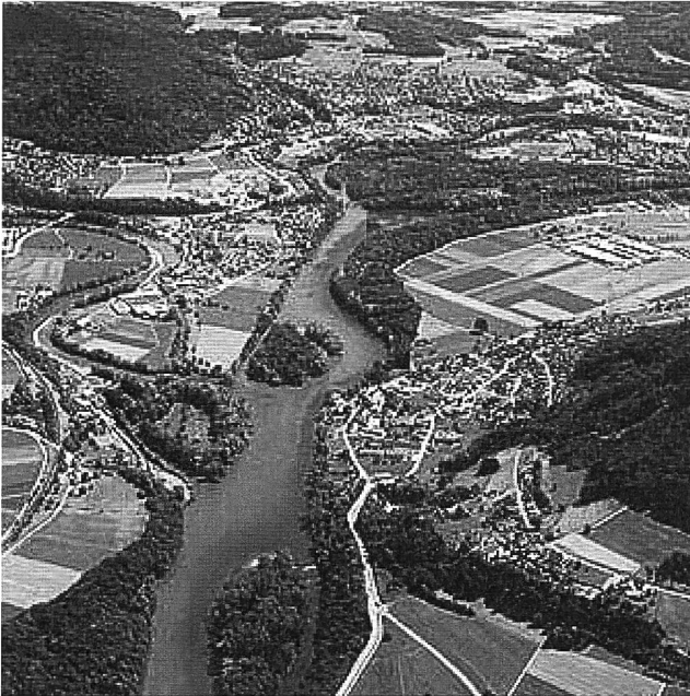
Abbildung 1: Wasserschloss: Zusammenfluss von Aare, Reuss und Limmat.