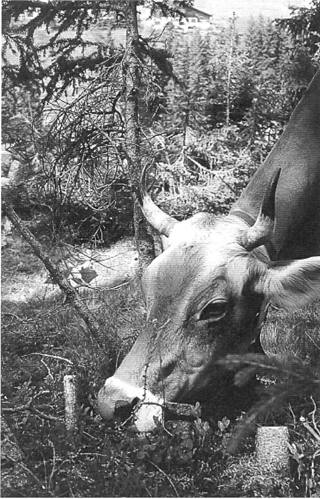
Abbildung 2: Die Rinder haben grosse Auswahl bei der Futterselektion auf subalpinen Waldweiden.