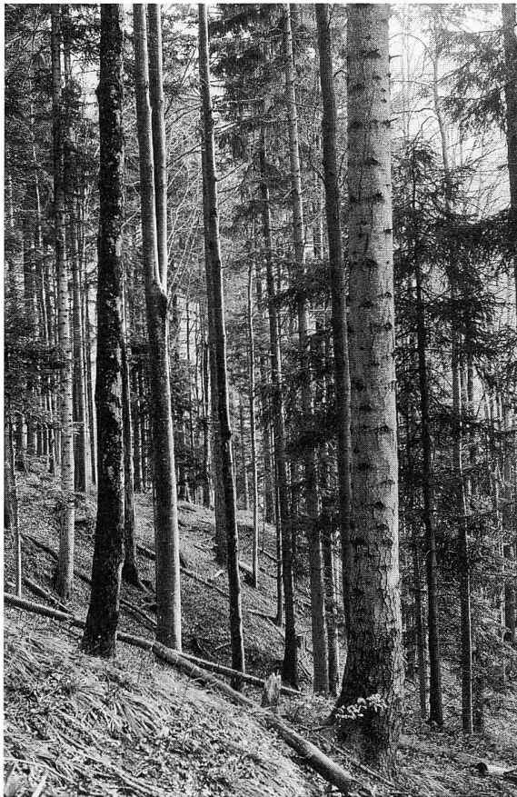
Abbildung 1: Vorratsreiches Baumholz, naturnah, Alter 100 Jahre, auf Tannen-Buchenwaldstandort, Urnäsch, 1000 m ü.M.

wieder einzelne mehrschichtige, stufige und gemischte Partien oder naturnahe Jungwälder. Der Anteil von 21% gemischten Stufen an der Gesamtwaldfläche ist immerhin ein Hinweis darauf, dass die Bemühungen um einen naturnahen Waldaufbau während der letzten Jahrzehnte nicht umsonst waren.