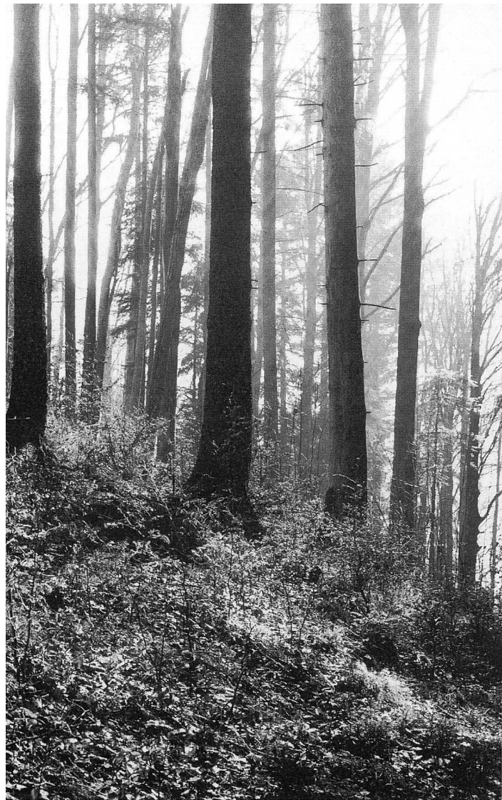
Abbildung 3: Übergang zur nächsten Generation im Femelschlagverfahren. Vorhandene Naturverjüngung muss als Zukunftsbestand erhalten bleiben.

Schutzfunktion des Waldes und erachtet deren Wirkungen als Selbstverständlichkeit. Dabei werden häufig keinerlei Gedanken daran verloren, dass auch der Wald jemandem gehört und dass die Waldbesitzer zugunsten der Öffentlichkeit in der freien Verfügung über ihr Eigentum eingeschränkt sind. An den Wald werden die verschiedenartigsten Ansprüche gestellt. Er ist Holzlieferant, Erholungsgebiet, letztes Stück unberührte Natur, Verhinderer von Rutschungen, Lieferant von Quellwasser, Lebensraum für Wildtiere, Hindernis bei Bauvorhaben, Schattenverursacher und Konkurrent des offenen Landes. Gerade in einer Gegend mit überwiegend privaten Wäldern wie in Appenzell A.Rh. ist eine gegenseitige Respektierung von Waldbenutzern und Waldbesitzern ausgesprochen wichtig.