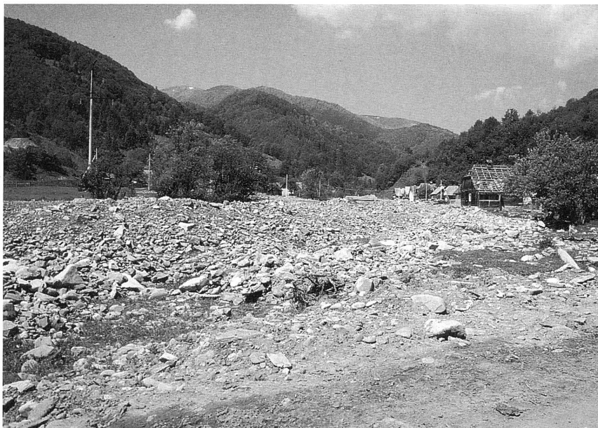
Abbildung 1: Im zweiten Jahr nach der Flut sind die Heimatdörfer der Praktikanten noch immer verwüstet (Oberes Theresiental Transkarpatien, Ukraine, Mai 2000).

Die Praktikanten wurden überall in engagierter und interessierter Persönlichkeiten geschätzt und äusserten sich zufrieden über ihren Aufenthalt. Wären die Sprachkenntnisse im fachlichen Bereich besser und das Instruktionspersonal mit den Verhältnissen in den Karpaten vertraut gewesen, so hätte die Ausbildung noch wesentlich gewonnen. Die Praktikanten waren beeindruckt von der