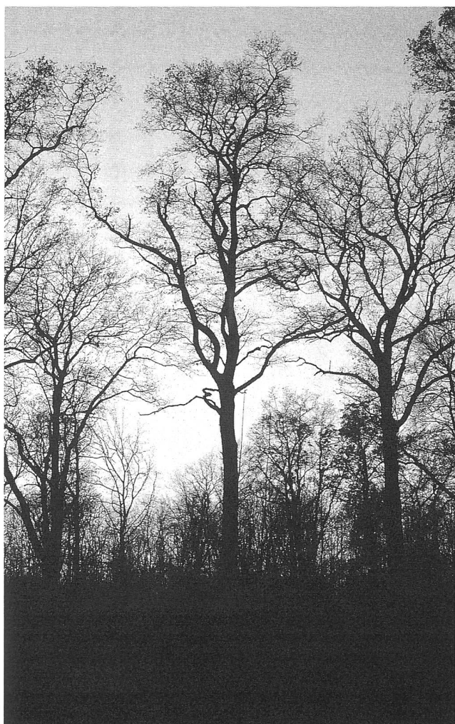
Abbildung 3: Eichen im Romanshorner Wald, Exkursion C.