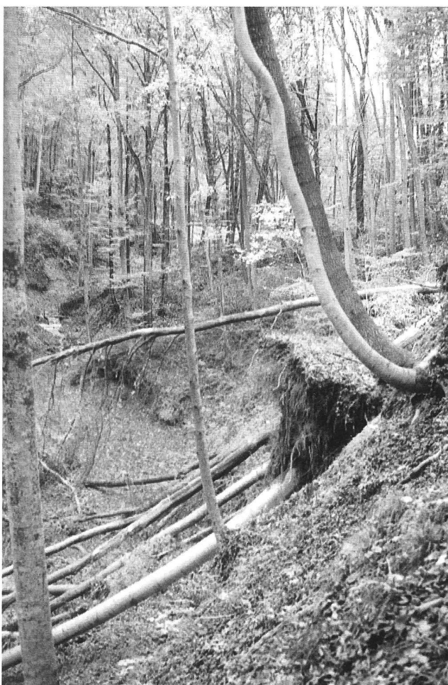
Abbildung 4: Chalcherentobel, Weinfelden, Exkursion D. Ohne minimale Pflege entwickeln sich Wälder in Bachtobeln vom Schutz zum Risikofaktor.

Am Weg liegen aber auch verschiedene Rosinen landschaftlicher und denkmalpflegerischer Art.