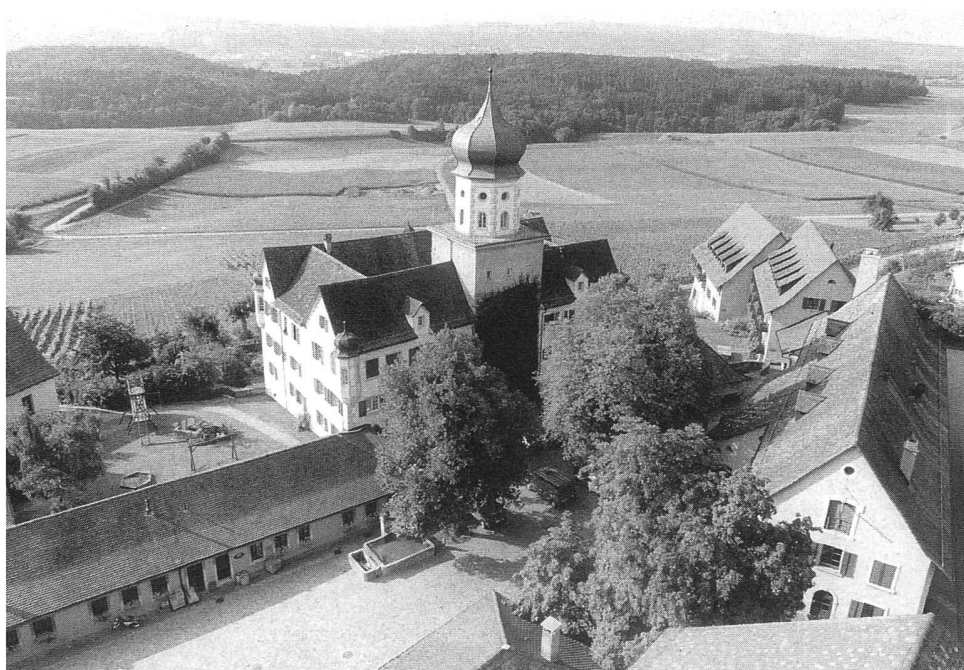
Abbildung 1: Schloss Herdern, Exkursion A.

Die Carfahrt führt durch das landschaftlich interessante BLN-Gebiet des Untersee-Rheins.