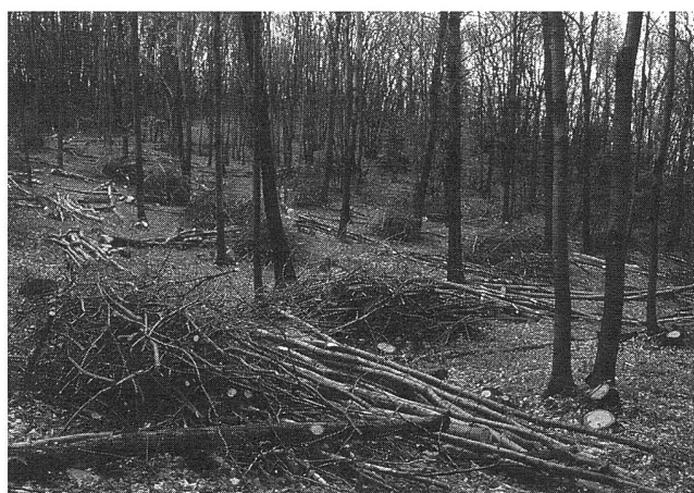
Figura 2: Monte di Caslano: dirado dell'aggregato castanile esistente.

L'attuazione pratica di questi nuovi indirizzi presupponeva tuttavia, oltre naturalmente ad una sufficiente disponibilità di mezzi finanziari, la creazione di un'adeguata accessibilità, mano d'opera ben istruita (forestali e selvicoltori) ed una