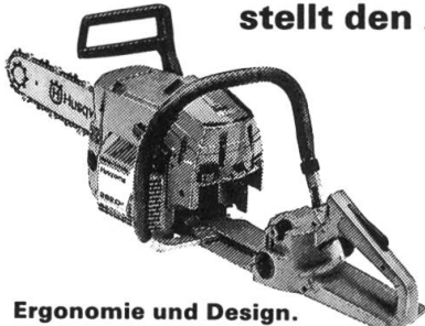
Ergonomie und Design. Antivibration.

Das Husqvarna-Konstruktionskonzept stellt den Anwender in den Mittelpunkt.