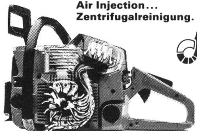
Air Injection... Zentrifugalreinigung.