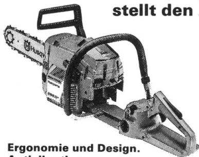
Ergonomie und Design. Antivibration.

Das Husqvarna-Konstruktionskonzept stellt den Anwender in den Mittelpunkt.