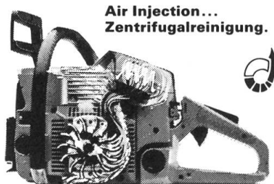
Air Injection... Zentrifugalreinigung.