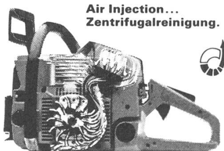
Air Injection... Zentrifugalreinigung.