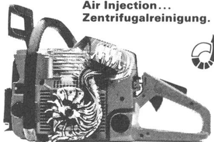
Air Injection... Zentrifugalreinigung.