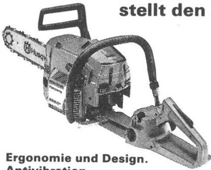
Ergonomie und Design. Antivibration.

Das Husqvarna-Konstruktionskonzept stellt den Anwender in den Mittelpunkt.