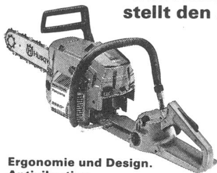
Ergonomie und Design. Antivibration.

Das Husqvarna-Konstruktionskonzept stellt den Anwender in den Mittelpunkt.