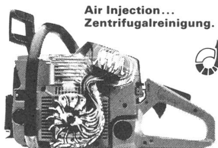
Air Injection... Zentrifugalreinigung.