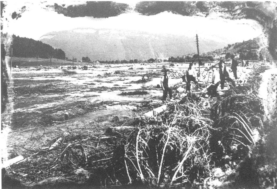
Abbildung 1. Hochwasser vom Juni 1910. Blick von Büren in Richtung Stans.

Die Schutzdämme und Wuhren, die in den folgenden Jahrhunderten von der hochgehenden Engelberger Aa immer wieder beschädigt und zerstört worden sind, wurden erst ab 1911 massiv gebaut und verstärkt. Anlass dazu war wieder ein Katastrophenhochwasser. Im Juni 1910 durchbrach die Engelberger Aa die Dämme oberhalb Büren und setzte die Stanserebene in diesem Jahrhundert letztmals unter Wasser ( Abbildung 1 ).