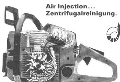
Air Injection... Zentrifugalreinigung.