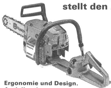
Ergonomie und Design. Antivibration.

Das Husqvarna-Konstruktionskonzept stellt den Anwender in den Mittelpunkt.